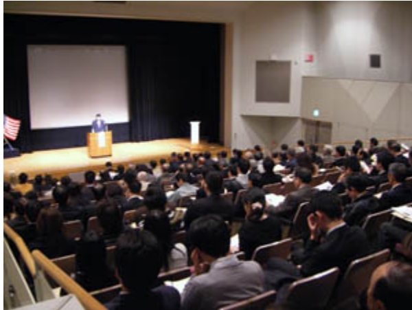
会場全景（NTT夢天神ホール／福岡市中央区）