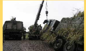
応急脱出訓練 (第3直接支援小隊)