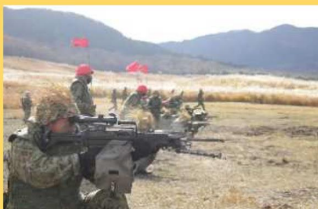
総合戦闘射撃訓練 (24連隊)