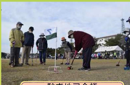
駐屯地司令杯 グラウンドゴルフ大会