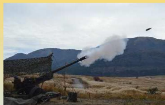
総合戦闘射撃訓練 (第3大隊)