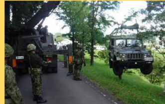
搭載卸下訓練 (第308普通科直接支援中隊)