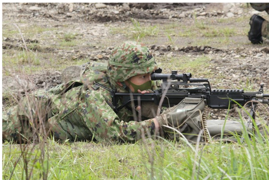
写真：第24普通科連隊 射撃訓練 (提供：陸上自衛隊えびの駐屯地広報室)