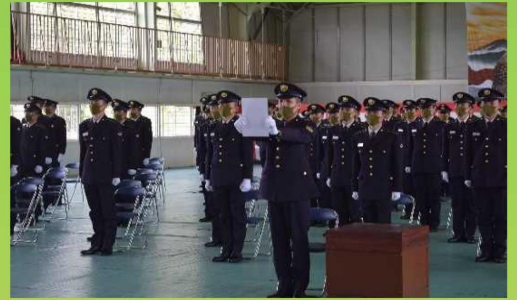
令和3年4月一般陸曹候補生 入隊式