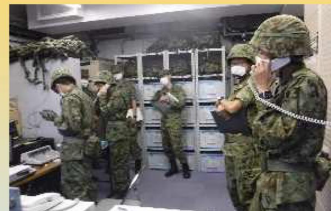
電波障害バックアップ訓練 (基地通信隊)