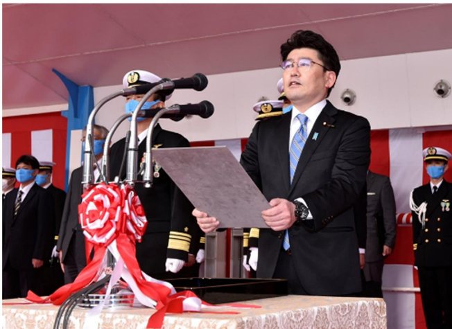
▲自衛艦命名式（防衛副大臣から「みくま」と命名）

「みくま」は令和5年3月就役予定であり、これから就役に向けた本格的な装工事及び海上での確認運転等が計画されています。九州防衛局長崎防衛支局では引き続き、監督・検査に万全を期して参ります。