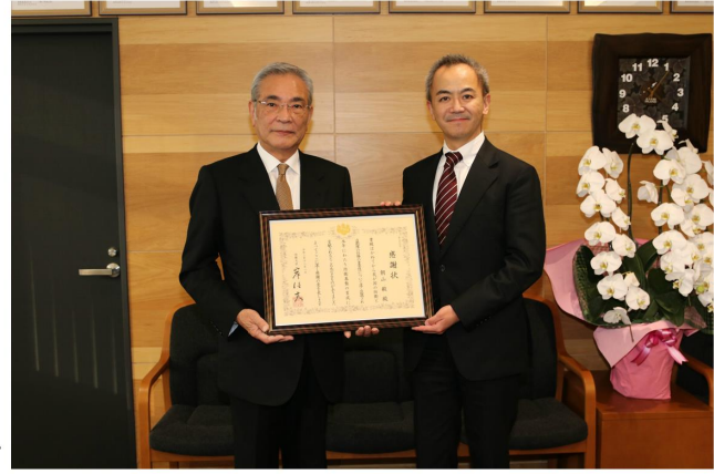
▲朝山前市長（左）、遠藤企画部長（右）