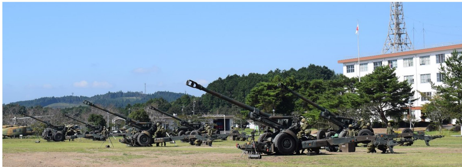
写真：西部方面特科連隊第3大隊 操砲訓練 (提供：陸上自衛隊えびの駐屯地広報室)