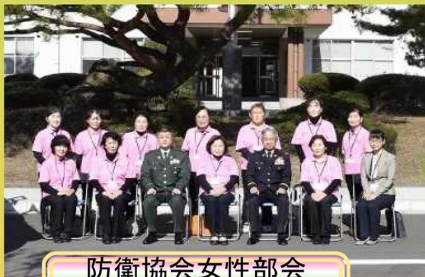
防衛協会女性部会 えびの支部