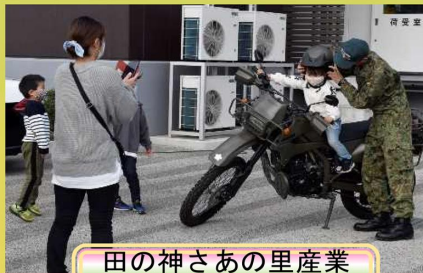
田の神さあの里産業 文化祭装備品展示