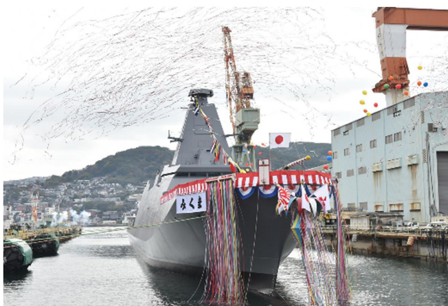
▲進水式（護衛艦「みくま」が進水）