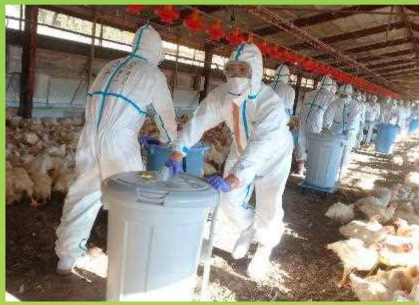
令和2年鳥インフルエンザ