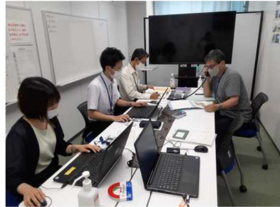
▲九州防衛局現地連絡所の様子

九州防衛局としては、訓練の実施に当たっては、地元自治体、周辺住民の方々の御理解と御協力が不可欠であると考えており、今後とも地元自治体、周辺住民の方々の不安や懸念を解消すべく、誠心誠意努力してまいります。