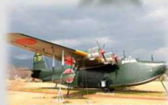
二式大型飛行艇展示機