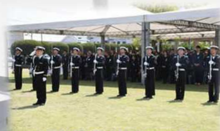
慰霊祭儀仗隊等派出