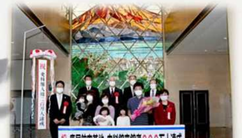
史料館来館者200万人達成

鹿屋航空基地では、鹿屋航空基地開隊記念行事、慰霊祭では儀仗隊・ラツパ隊・慰霊飛行等、高校生や中学生への職場体験学習も実施しております。また鹿屋市と共催した『エアーマモリアルinかのや』で地域と共に地域活性化を図り、『かのや夏祭り』では隊員約100名で総踊りに参加しています。