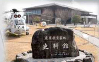
鹿屋航空基地史料館