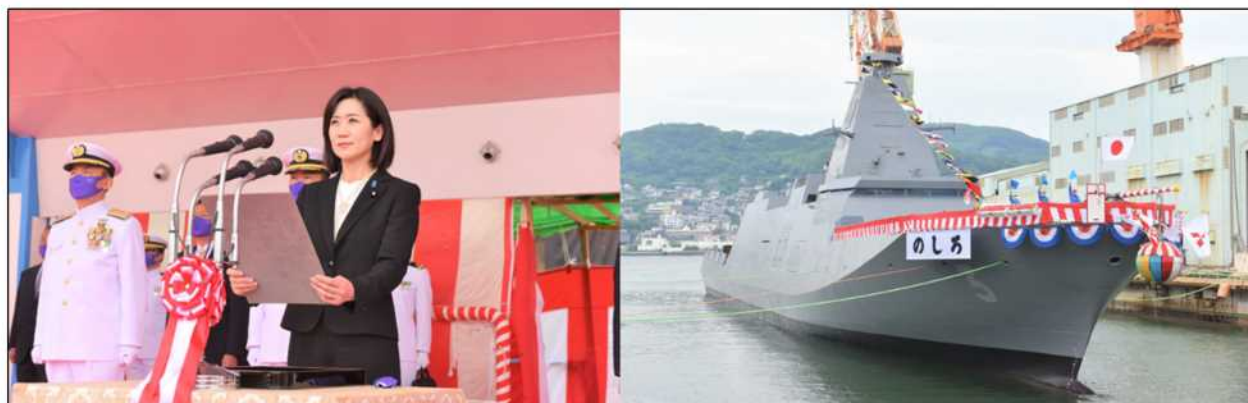
▲現自衛艦命名式（松川防衛大臣政務官から「のしろ」と命名）

「のしろ」は令和4年12月就役予定であり、これから就役に向けた本格的な装工事及び海上での確認運転等が計画されています。九州防衛局長崎防衛支局では引き続き、監督・検査に万全を期して参ります。