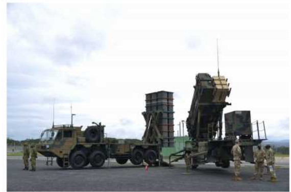
▲陸自の中SAM（左）と米軍のペトリオット（右）