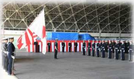
鹿屋航空基地開隊記念行事