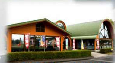
鹿屋市観光協会物産館

海上自衛隊鹿屋航空基地史料館には、昭和11年に海軍鹿屋航空隊が開隊して以来、現在の海上自衛隊に至るまでの豊富な史料が展示してあります。海軍精神発露の史実、先の大戦における特別特攻隊にまつわる遺品や零戦の実機展示、屋外には二式大型飛行艇も展示しております。※入館料：無料