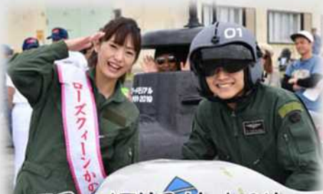
エアーマモリアルinかのや