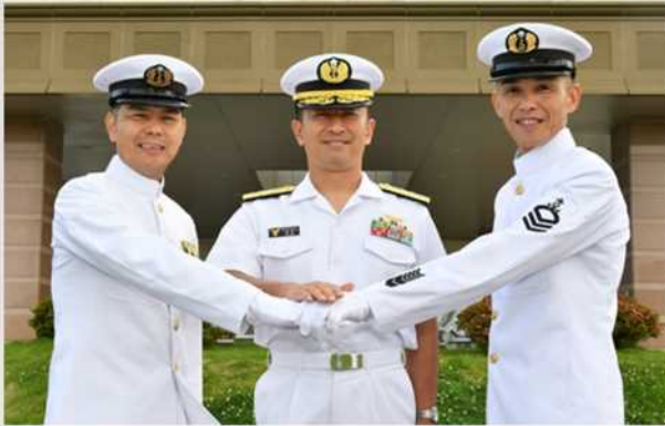
(ふじわら なおちか)