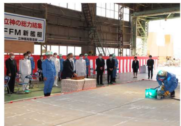
▲起工の儀（三原長崎防衛支局長による溶接スイッチ押下）