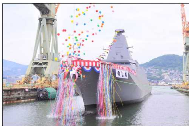
▲進水式（護衛艦「のしろ」が進水）