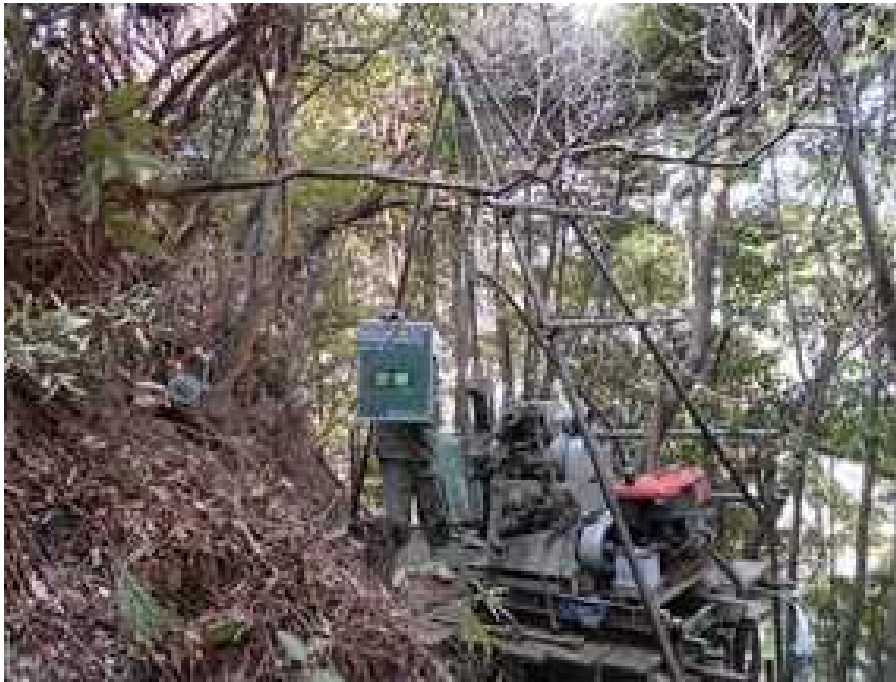
ボーリング調査（イメージ）

適地を検討している場所（中岳）においてボーリング調査や採取した土の強度等の調査を行います。