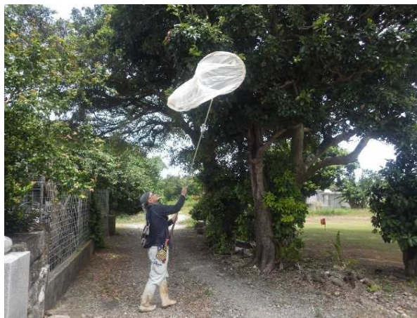
動植物調査（イメージ）