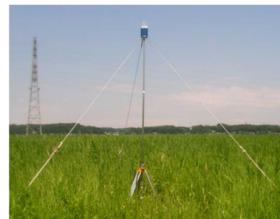
粉じん調査（イメージ）