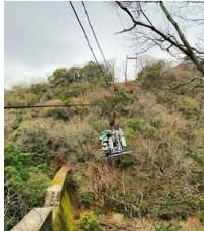
仮設索道（イメージ）