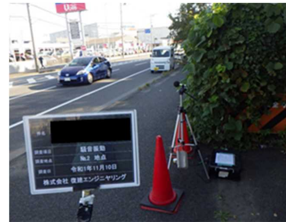
騒音・振動調査（イメージ）