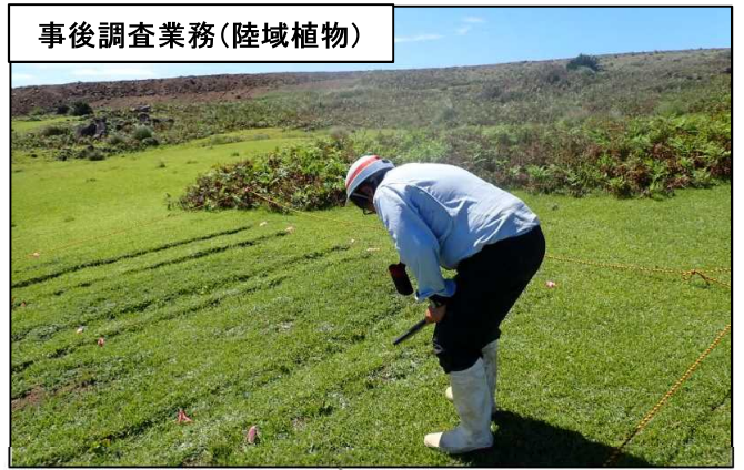
事後調査業務(陸域植物)