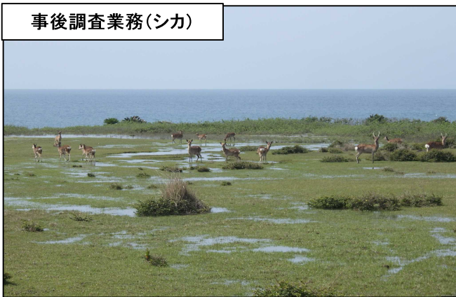
事後調査業務(シカ)