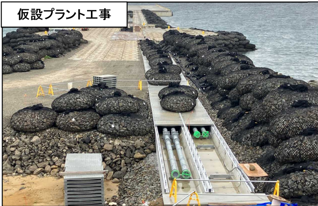
仮設プラント工事