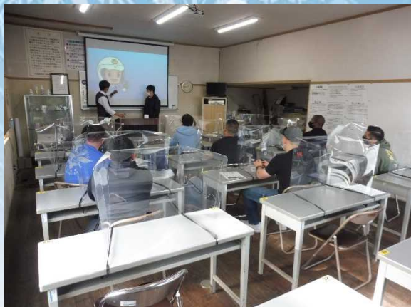
冬季の注意点等に関する警察の講義

今回の講習会では、万全な新型コロナウイルス感染症対策のもとで、これから本格的な降雪期を迎えることを踏まえ、特に冬季の運転において注意を要する事項に重点を置いた座学講義や、人工降雪機を使用して再現した積雪路の走行などの実車講習を行いました。