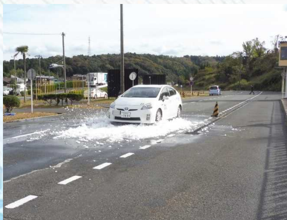
積雪路面（平地）におけるスリップ体験