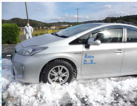
積雪路面（坂道）におけるスリップ体験