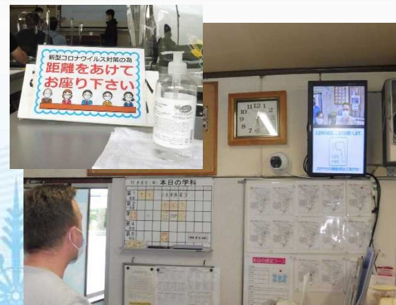
万全な新型コロナウイルス感染症対策のもとでの講習