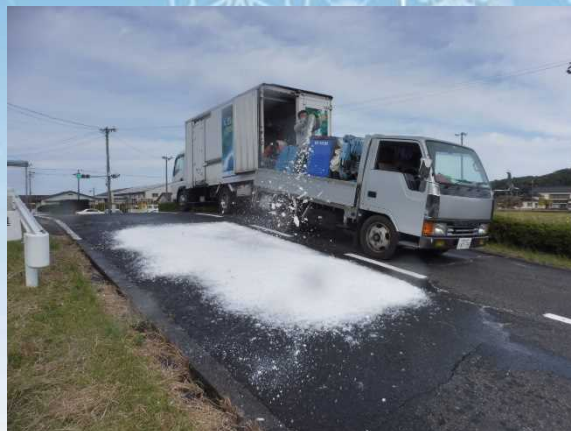
人工降雪機による積雪路の再現