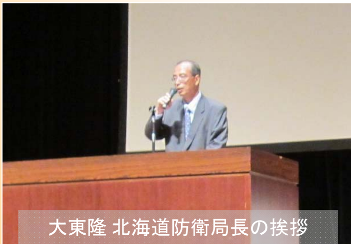
大東隆 北海道防衛局長の挨拶