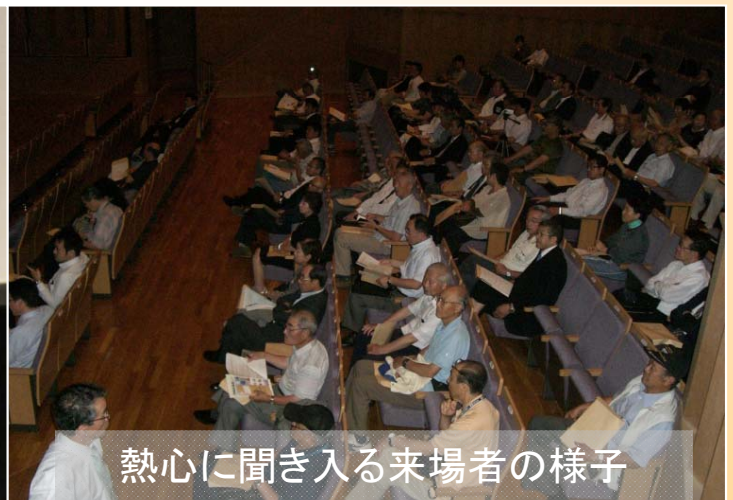
熱心に聞き入る来場者の様子