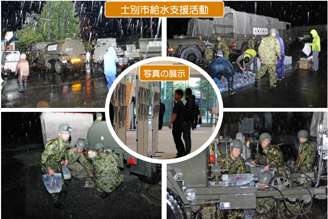
士別市給水支援活動

セミナー会場において、今回のテーマに合わせ、名寄駐屯地の協力の下、災害派遣活動の状況写真や災害用装備品の展示を行いました。