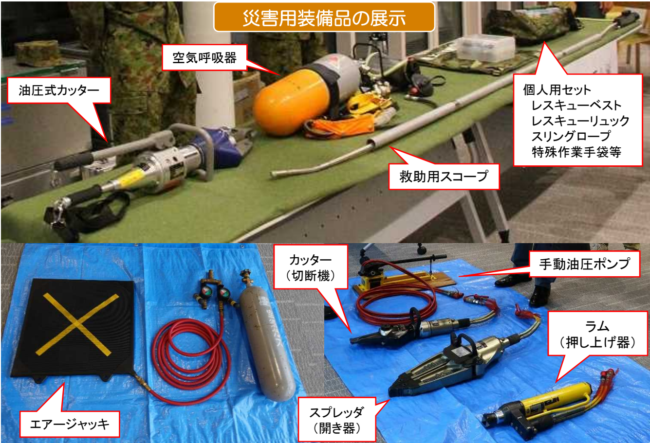
災害用装備品の展示