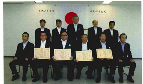
北海道防衛局 優秀工事等顕彰状受賞者

また、今回顕彰を受賞された受注者の皆様におかれましては、引き続き他の模範となる優秀な工事を目指していただけることを期待しております。