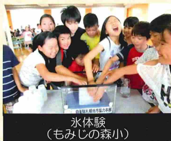
氷体験（もみじの森小）

また、氷の贈呈には、海上自衛隊の帽子を被った札幌地方協力本部キャラクター羊の「モコ」も駆け付け、児童からは「かわいい～!」「モコちゃん!」と声をかけられるなど、絶大な人気がありました。