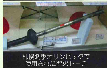
札幌冬季オリンピックで 使用された聖火トーチ