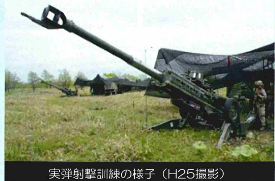
実弾射撃訓練の様子 (H25撮影)

当局としては、今後も引き続き、訓練の実施に際し、適宜適切な情報提供に努めるなど、地元の皆様の御不安、御心配が解消されるよう最大限努力するとともに、訓練を安全かつ円滑に実施できるよう万全を期してまいりますので、今後とも御理解と御協力をお願い申し上げます。