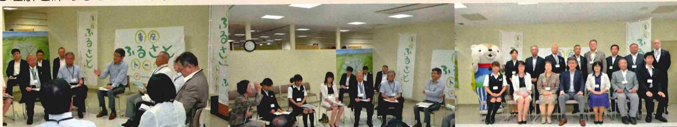
副大臣主催の「車座ふるさとトーク」の様子 副大臣（左、右）中央、（中央）右から1人目