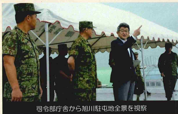
司令部庁舎から旭川駐屯地全景を視察

また、6日実施された副大臣主催の「車座ふるさとトーク」では、旭川市内のフィール旭川7階会議室で、学校関係者及び自治体職員等の市民14名と副大臣のフリートークが行われました。「北海道地域の『守り』をどうするか？」をテーマとして副大臣から市民に対し、防衛政策について説明するとともに、災害派遣隊員のケアや厳しい募集環境などに関する市民からの質問に対しては副大臣が丁寧に回答する等、市民の防衛に関する理解を深めるとともに、貴重な意見を聴く機会となりました。