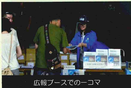
広報ブースでの一コマ

この日は上空に雲が低く垂れ込む天候であったため、F15戦闘機の機動飛行が中止となったり、ブルーインパルスの展示飛行の内容が大幅に変わるなど航空ショーは予定変更が相次ぎましたが、会場内の展示等のイベントが行われているところは多くの来場者で終始賑わっていました。