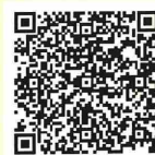
スマートフォン版QRコード