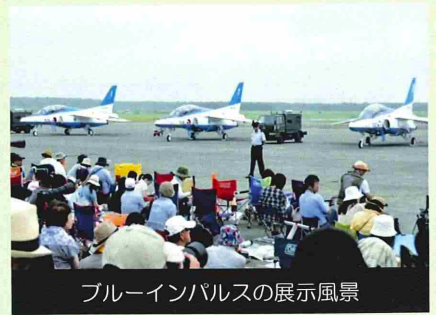
ブルーインパルスの展示風景

平成26年8月3日、航空自衛隊千歳基地（千歳市平和）において航空祭が開催されました。千歳基地の航空祭は、千歳の夏の一大イベントであり、一般開放された千歳基地には今年もたくさんの市民や道内の航空ファンが訪れました。会場では、戦闘機やヘリコプターなど様々な航空機の地上展示や北部航空音楽隊による演奏会が行われたほか、米空軍三沢基地所属のF16戦闘機によるアクロバット飛行や、航空自衛隊松島基地所属のアクロバットチーム「ブルーインパルス」による編隊飛行などが披露され、約62,000人の来場者を楽しませました。