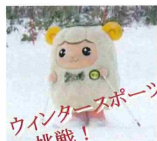
ウィンタースポーツに挑戦！

昨年は「ゆるキャラグランプリ2013」にエントリー。「企業・その他」の部で26位と健闘しました。もちろん今年もエントリー。皆さんからの投票で今年はさらに上位をめざします。札幌地本ホームページの「モコの部屋」には、モコの壁紙や歌など楽しいコンテンツを用意しています。