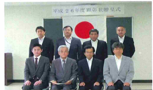
帯広防衛支局 優秀工事等顕彰状受賞者