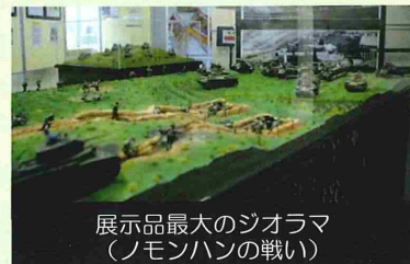
展示品最大のジオラマ （ノモンハンの戦い）

※史料館への見学申込みは、 第7師団広報・渉外班：電話0123-23-5131（内線2136、2245）