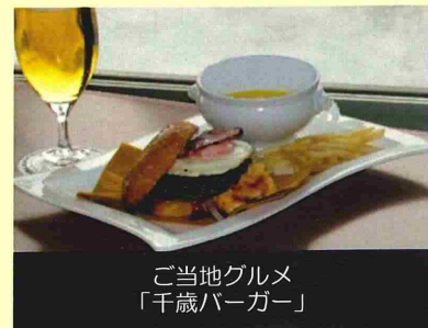
ご当地グルメ 「千歳バーガー」

また、道内全ての自治体が加入する「北海道自衛隊駐屯地等連絡協議会」の会長としても、北海道における自衛隊の体制が維持、強化されるよう積極的に活動してまいります。