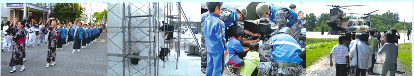
あばしりオホーツク夏祭り

来年は、昭和30年の空自部隊展開から記念すべき分屯基地創設60周年を迎えます。航空自衛隊に関する理解を深めていただくため、創意工夫を凝らし皆様をお出迎えしたいと思いますので、是非、開庁記念行事にお越し下さい。