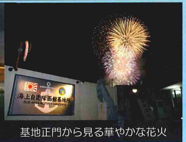
基地正門から見る華やかな花火