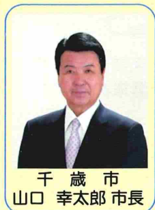
千歳市 山口 幸太郎 市長

千歳市は、国立公園支笏湖や清流千歳川など豊かな自然環境を有するとともに、空港、鉄道、高速自動車道が密接に結びつく交通の要衝であり、生産、流通の拠点として発展を続ける人口約95,300人のまちです。