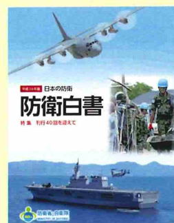
平成26年版防衛白書の表紙