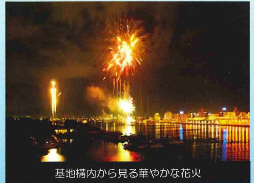
基地構内から見る華やかな花火

五島司令は「同花火大会を通じて市民との交流を深め、地域社会との融和を図り、防衛基盤の育成に努めたい。」と述べました。