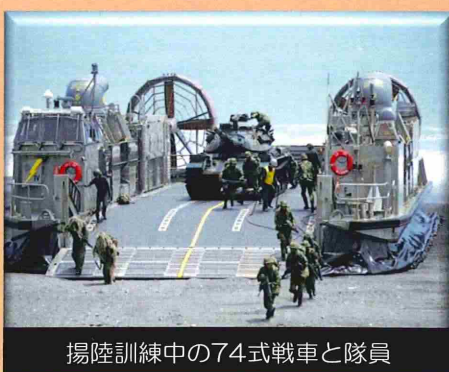
揚陸訓練中の74式戦車と隊員