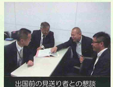
出国前の見送り者との懇談

南スーダンに到着後は、首都ジュバの自衛隊宿営地で約6か月間活動する予定で、派遣施設隊長の指揮の下、UNMISS司令部等と派遣施設隊との間における案件形成段階での技術的助言と、案件実施の際の設計及び施工など技術的な支援業務に従事することとなります。これまで数多くの施設建設業務で培った技術経験を活かし、建設工事に熟知した防衛技官ならではの活躍が期待されるところです。