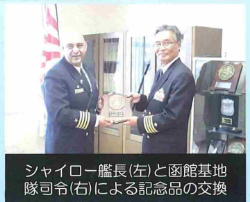
シャイロー艦長(左)と函館基地隊司令(右)による記念品の交換

同行事に合わせて15日（木）第3護衛隊「すずなみ」が入港するとともに16日（金）には米海軍イーグリスミサイル巡洋艦「シャイロー」（艦長：クリューシュ・F・モリス大佐）が入港、函館日米協会会長、在札幌米国首席領事、ニューポート市長、函館市副市長、自衛隊協力団体他多くの方が出席の中、和やかに入港歓迎行事が行われました。19日夜には函館山にある会場で前夜祭が行われ、素晴らしい夜景とともに日米関係者が友好を深めました。