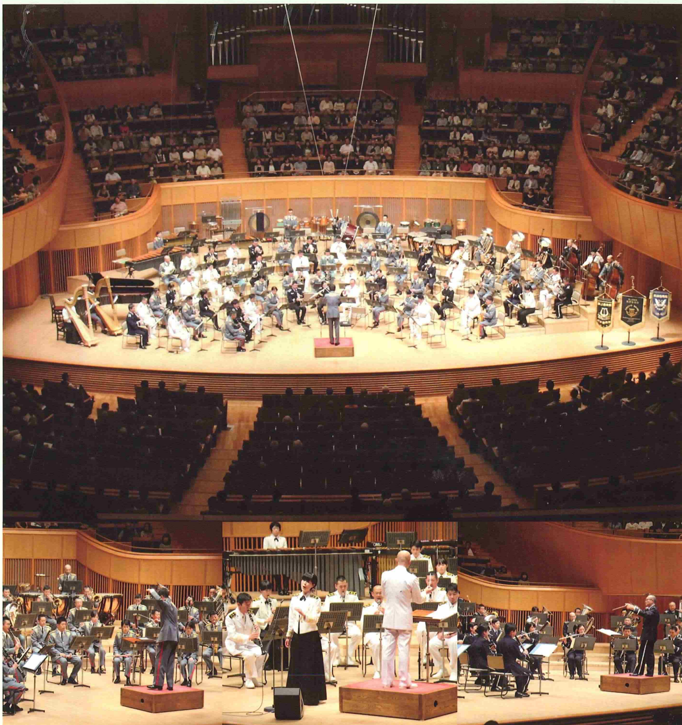
Photo : (上) 平成26年度陸・海・空自衛隊合同コンサートでの合同演奏(札幌コンサートホール Kitara) (下左) 陸上自衛隊中央音楽隊 (下中央) 海上自衛隊東京音楽隊と独唱する三宅3等海曹 (下右) 航空自衛隊航空中央音楽隊

編集・発行 防衛省北海道防衛局 広報誌等編集委員会 札幌市中央区大通西12丁目 札幌第3合同庁舎 Tel.011-272-7579 http://www.mod.go.jp/rdb/hokkaido/