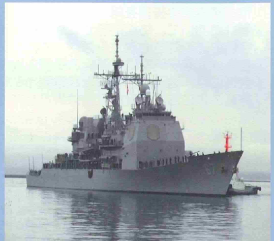
函館港に入港するシャイロー

当局としては今後とも米軍の行動等に伴う事務処理手続きについて適切に対処するよう取り組んでまいります。