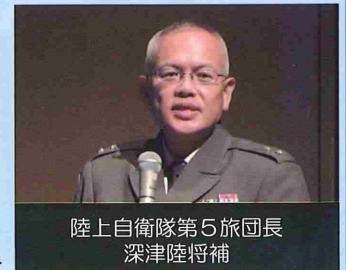
陸上自衛隊第5旅団長 深津陸将補