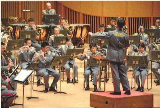
陸上自衛隊中央音楽隊 演奏曲「SF交響ファンタジー第3番」

この合同コンサートは、今年で17回目となり、国内外で評価が高い陸上自衛隊中央音楽隊（朝霞）、海上自衛隊東京音楽隊（市ヶ谷）及び航空自衛隊航空中央音楽隊（立川）の3つの音楽隊が一同に会し、本格的なクラシックを楽しんで頂く演奏会です。