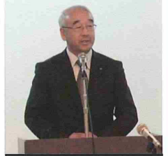
向山上富良野町長