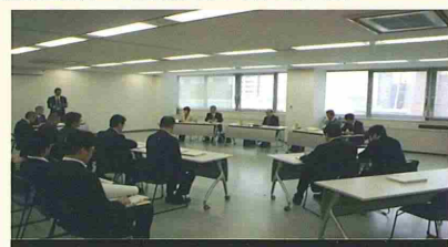
入札監視委員会での審議風景

なお、審議結果については、当局情報公開室に備え置いて閲覧に供しているとともに、当局ホームページにおいて公表しています。