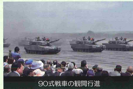
90式戦車の観閲行進

千歳事務所では、管内関係機関との連携強化を図るため、今後も管内で行われる各種行事において、引き続き情報交換等に努めていきたいと考えています。