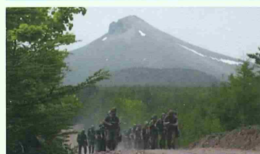
教育隊の25km徒步行進訓練