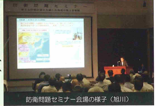
防衛問題セミナー会場の様子（旭川）

会場には、地元自治体のほか近隣市町村から大勢の方々が来場され、「有事の際に日本の安心安全は果たして守られるのか不安を感じつつ、通常時の訓練の重要性と北海道の役割の大きさを感じた。」「自衛隊は頑張っているが、国民の理解と協力・支援が絶対条件であると感じています。」などの声が寄せられました。