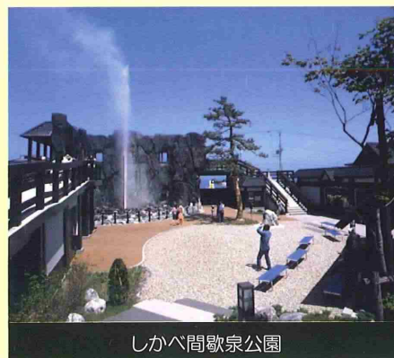
しかべ間歇泉公園

町内には駒ヶ岳演習場が所在し、道南唯一の隊員錬武の地として、函館駐屯地の部隊をはじめ、多くの隊員が汗を流しています。今年3月には、陸上自衛隊第28普通科連隊と「大規模災害時等における連携に関する協定書」の調印を行いました。北海道駒ヶ岳を擁する当町にとって、協定による連携の強化は、さらなる信頼関係の構築と町民の安全をもたらしてくれるものと確信しています。今後も、自衛隊との絆を大切に、共に歩むまちづくりを目指してまいります。