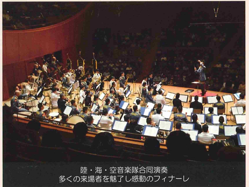
陸・海・空音楽隊合同演奏 多くの来場者を魅了し感動のフィナーレ

コンサート当日は初夏の北海道のさわやかな快晴のなか、陸海空の各音楽隊が、たゆまぬ努力で培った演奏技術により、心を込めて奏でる吹奏楽を会場に訪れた多くの来場者にじっくりとお楽しみ頂きました。