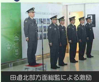
田邊北部方面総監による激励