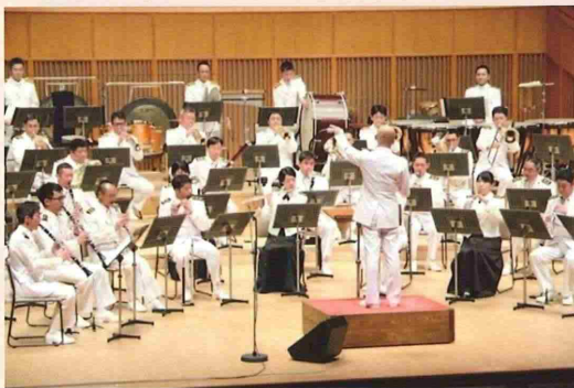
海上自衛隊東京音楽隊 行進曲「虹と雪」