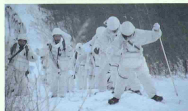
冬季におけるスキー行進訓練