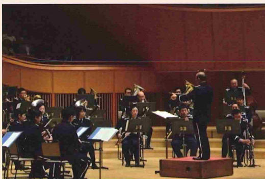
航空自衛隊航空中央音楽隊 演奏曲「セレブレーション」

コンサート当日は初夏の北海道のさわやかな快晴のなか、陸海空の各音楽隊が、たゆまぬ努力で培った演奏技術により、心を込めて奏でる吹奏楽を会場に訪れた多くの来場者にじっくりとお楽しみ頂きました。