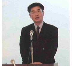
谷井地方協力企画課長