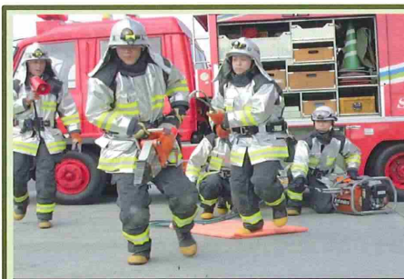
白老町：防火服の整備

担当署員の声： 最新消防車両の導入は、消防装備の充実が図られ、消火効率の向上・隊員の安全面についても強化され、住民の生命・財産の保全と被害の軽減に寄与し、地域全体の安心・安全に貢献するものと考えます。