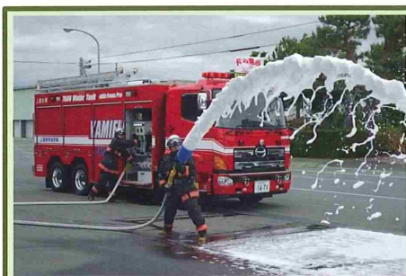
上富良野町：消防ポンプ付水槽車の整備

いずれも、当該交付金事業が防衛施設周辺の住民の方々への安全・安心を守るために役立てられています。