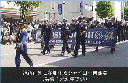
維新行列に参加するシャイロー乗組員

日本国とアメリカ合衆国との間の相互協力及び安全保障条約六条に基づく施設及び区域並びに日本国における合衆国軍隊の地位に関する協定