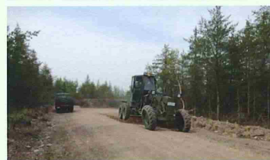
演習場整備における道路補修訓練