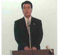
山口会長(千歳市長)