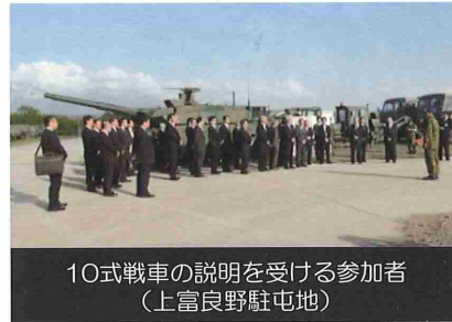
10式戦車の説明を受ける参加者 （上富良野駐屯地）

北海道防衛局としては、この総会を通じて、より防衛省・自衛隊への理解を深めていただき、関係住民の生活安定及び福祉の向上の推進等の活動に役立てていただけることを期待しております。