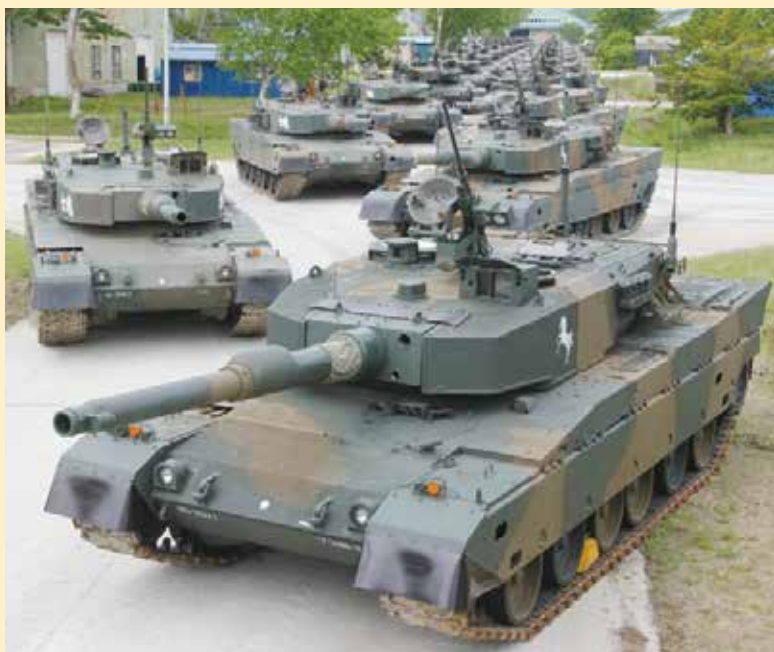
整然と並ぶ90式戦車

北恵庭駐屯地は、昭和25年9月、旧日本軍の北部軍教育隊跡地に警察予備隊恵庭訓練所として開設されました。