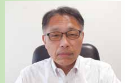
千歳防衛事務所長 笠井 正重

千歳防衛事務所管内には、重要な防衛施設が多数所在しており、これらの防衛施設の安定的な運用に寄与できるよう、関係自治体や地域住民の皆様との信頼関係の更なる発展のため、微力ではありますが努力して参りますので、よろしくお願い申し上げます。