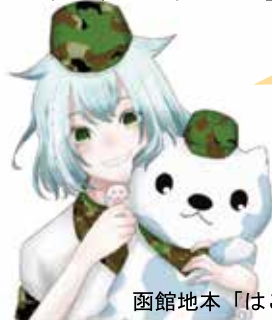
函館地本「はこっち」