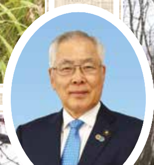
上野 正三 市長