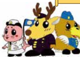
帯広地本「帯広地本トリオ」

@SDFhakotti @sapporo_PCO @asahikawa_PCO @hp1obihiropco