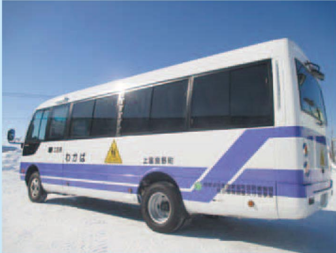
スクールバス購入 (上富良野町)