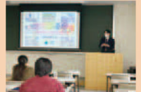
学生への説明会の様子

また、道内の学校へ直接出向き、生徒の皆様への業務説明会なども実施しております。就職支援ご担当者様へのご説明も行っておりますので、ご要望・質問等がありましたら下記お問い合わせ先までご連絡お待ちしております。