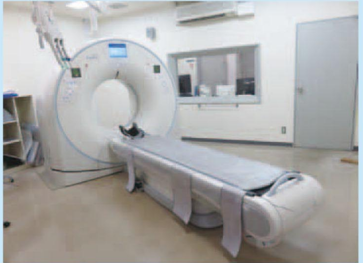
全身用X線CT診断装置 (厚岸町)