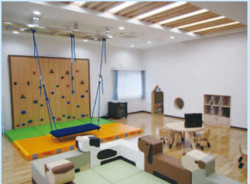
文化交流サロン備品購入 (苫小牧市)