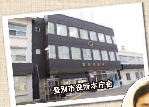
登別市役所本庁舎