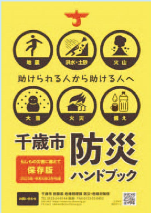
防災ハンドブック作成 (千歳市)