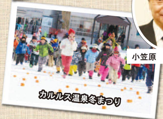
カルルス温泉冬まつり