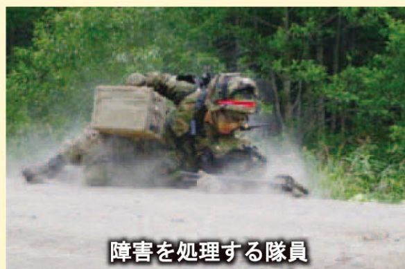
障害を処理する隊員

幌別駐屯地は、温泉で全国的に有名な登別市の中心部、幌別市街地の近くに位置しております。