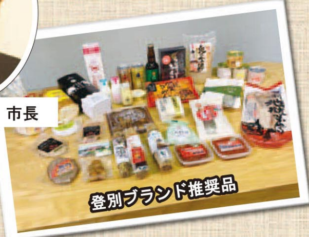
登別ブランド推奨品

陸上自衛隊幌別駐屯地には、本市の総合防災訓練への参加やイベントでの北海自衛太鼓の演奏をはじめ、様々な地域の活動にご協力いただいています。また、昨年、大津波警報発表時に近隣住民等が速やかに避難できるよう、駐屯地内を一次的な避難経路として通行できるように協定を締結しました。