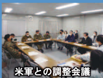
米軍との調整会議