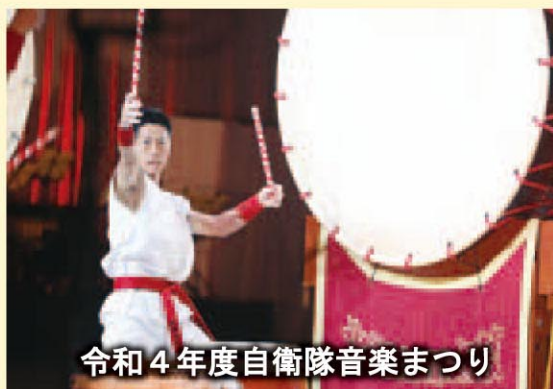
令和4年度自衛隊音楽まつり