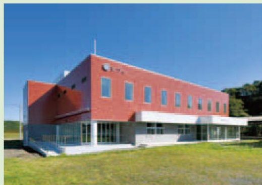
登別市観光交流センター(愛称:ヌプル)

また、軽飲食等を提供するテナントやお土産品等を取扱う物販コーナーのほか、オープンスペースやキッズスペースなど、複合的に機能を有する施設です。JR登別駅すぐ横に立地し、アクセス簡単。「湯之国登別」そして「ヌプル」へ是非お越しください。