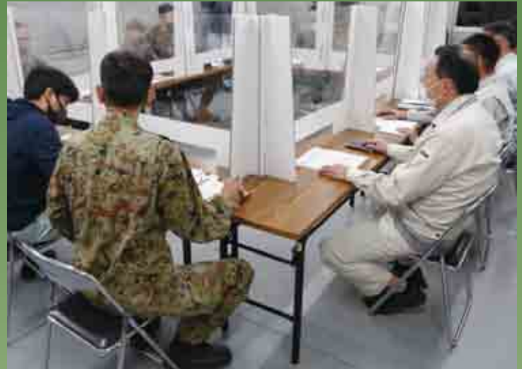
米軍との調整会議