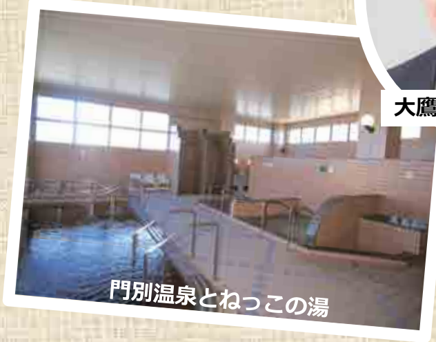
門別温泉とねっこの湯