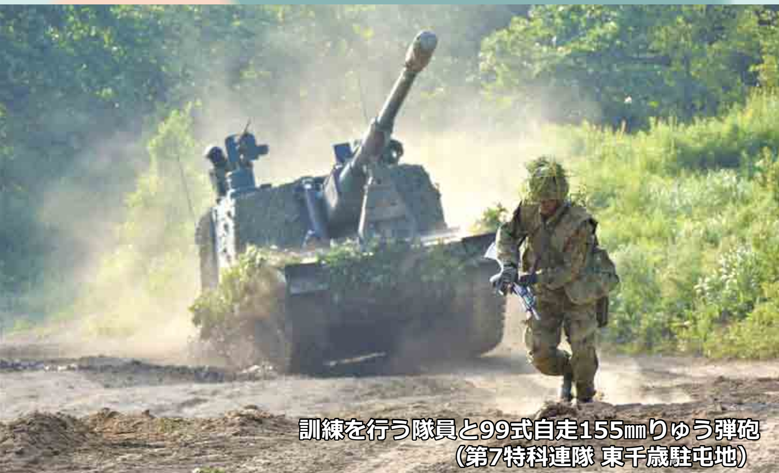
訓練を行う隊員と99式自走155mmりゅう弾砲 (第7特科連隊 東千歳駐屯地)