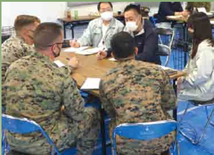
米軍との業務調整