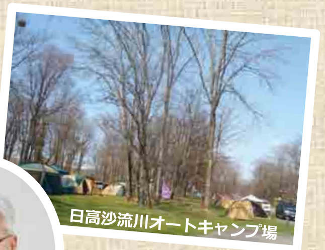
日高沙流川オートキャンプ場