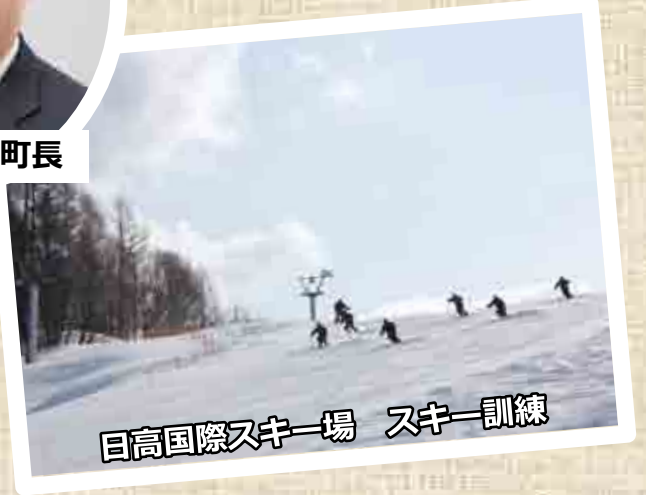
日高国際スキー場 スキー訓練

日高町に駐在する日高分屯地の隊員には、イベント参加や大会従事等、地域行事へ参画して頂いており、事業運営に欠かせない存在となっています。