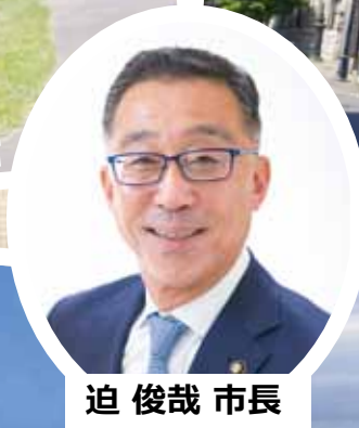
迫 俊哉 市長