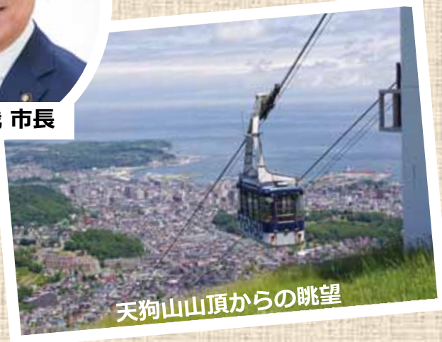
天狗山山頂からの眺望

小樽市を隊区として担任する陸上自衛隊第11特科隊には、例年9月頃の小樽市総合防災訓練に御参加していただいています。特に、平成30年9月に起こった北海道胆振東部地震の際には、いち早く連絡幹部を派遣くださり、また、令和3年4月には小樽市防災会議委員への就任など、積極的に御尽力いただいております。