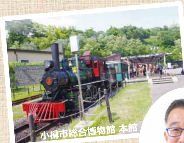
小樽市総合博物館 本館