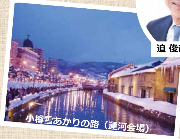
小樽雪あかりの路（運河会場）