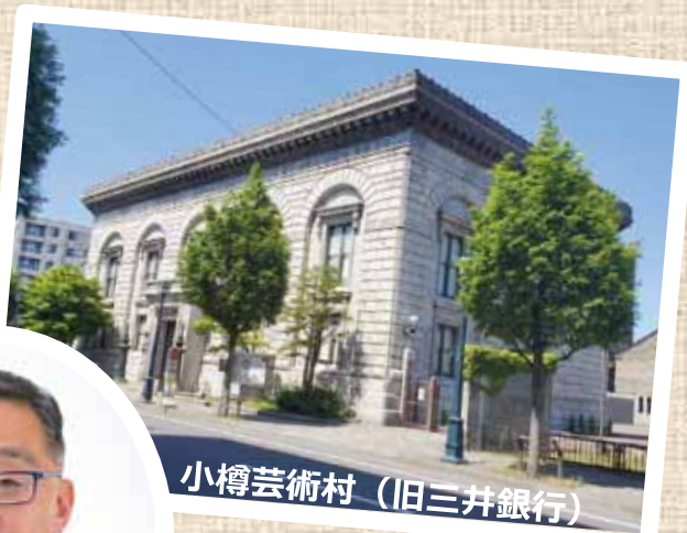
小樽芸術村（旧三井銀行）