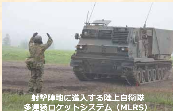
射撃陣地に進入する陸上自衛隊 多連装ロケットシステム（MLRS）

共同実射訓練の整齊とした実施により、日米安全保障体制の実効性の維持・向上に寄与しました。