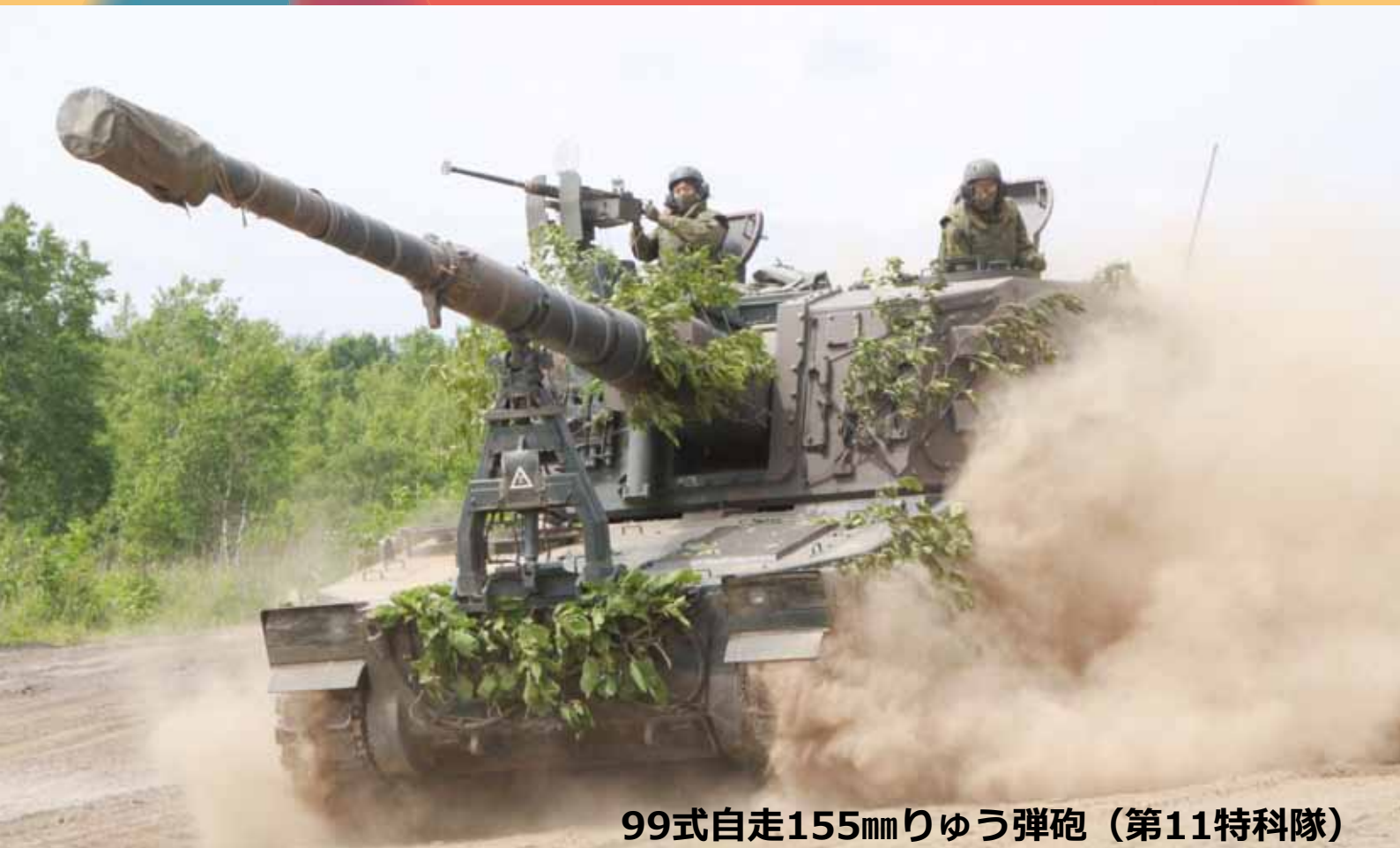
99式自走155mmりゅう弾砲（第11特科隊）