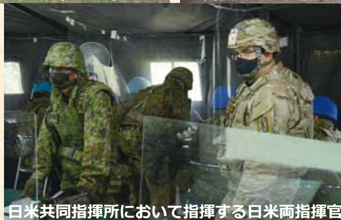
日米共同指揮所において指揮する日米両指揮官