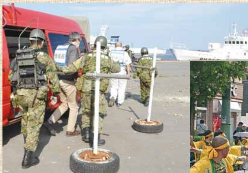
令和2年度 小樽市総合防災訓練

さらに、例年7月末に行われる小樽市最大の夏祭り「おたる潮まつり」では、潮ねりこみに御参加のほか、海上自衛隊の艦艇も小樽港に寄港していただき、市民にとって身近な存在となっております。