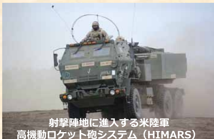
射撃陣地に進入する米陸軍 高機動ロケット砲システム（HIMARS）