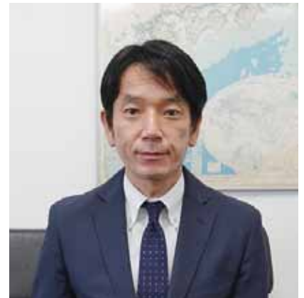
北海道防衛局次長 もろ はやと 茂籠 勇人

微力ではありますが、防衛省・自衛隊が円滑に活動できるよう、防衛行政の拠点として関係自治体や住民の皆様にご理解とご協力、そして信頼を得られるように全力で努めて参ります。