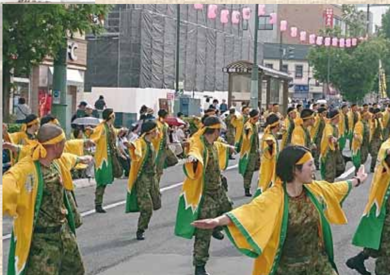
おたる潮まつり 潮ねりこみ参加の様子