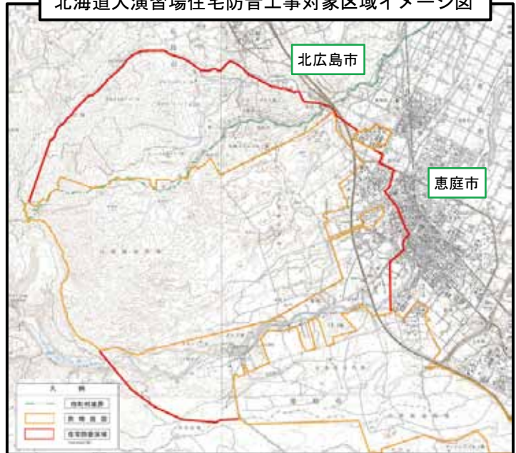
北海道大演習場住宅防音工事対象区域イメージ図

○防音工事の概要や事務手続きについては、当局ホームページに掲載しています「住宅防音工事の事務手続きについて演習場周辺（砲撃音）住宅防音工事」をご参照ください。