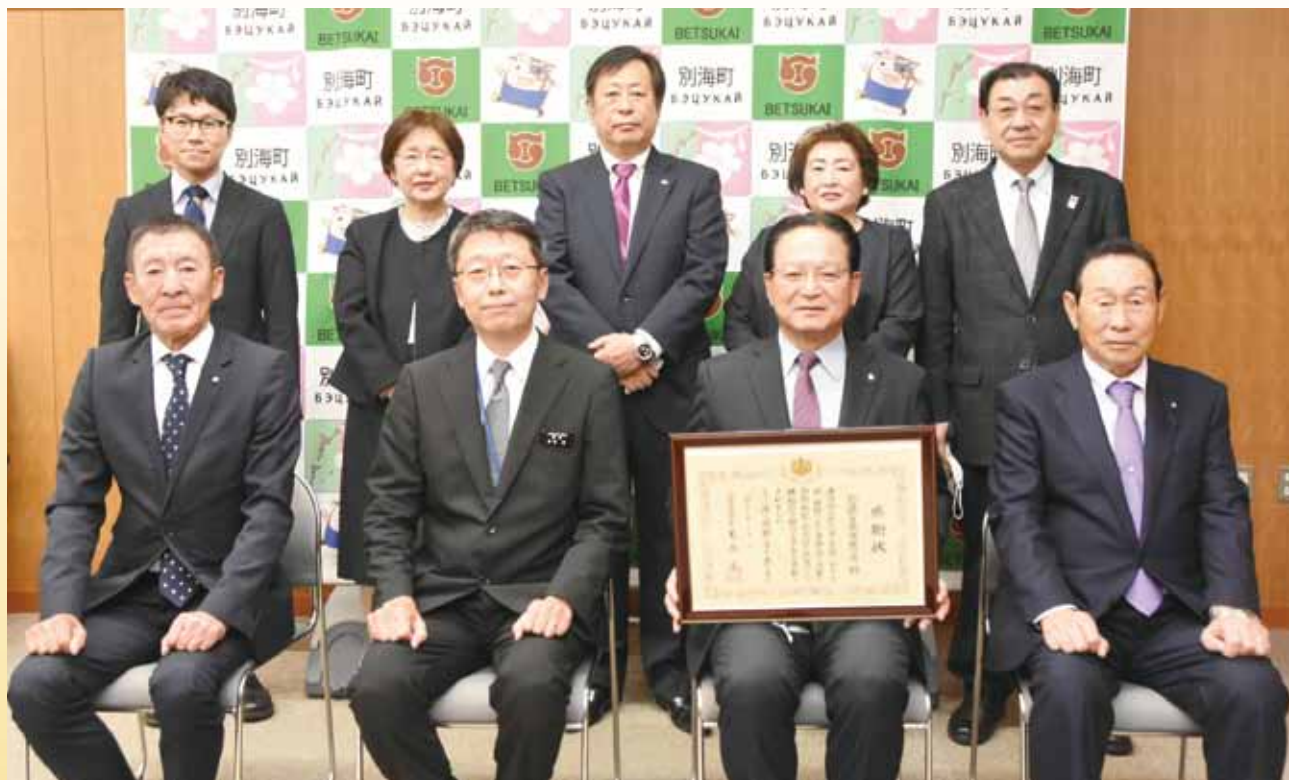
別海町自衛隊協力会