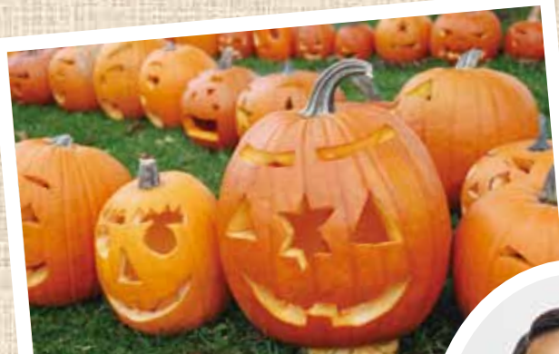
えにわハッピーハロウィン