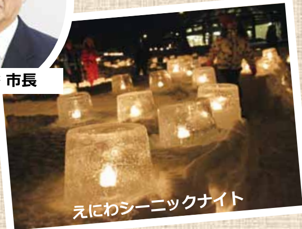
えにわシーニックナイト