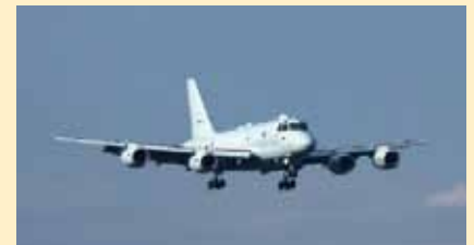
固定翼哨戒機（P-1）の取得