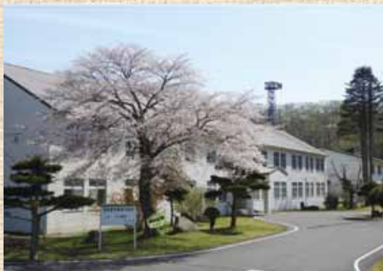
満開の桜と本部隊舎