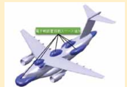
スタンド・オフ電子戦機の開発（イメージ）