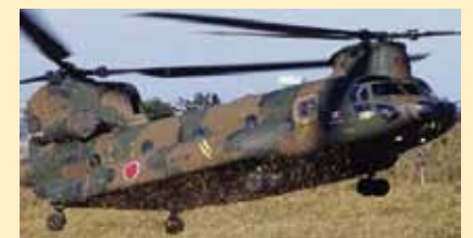
輸送ヘリコプター（CH-47JA）