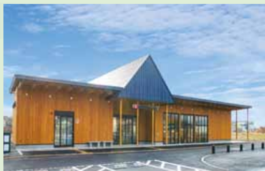
白老駅北観光インフォメーションセンター

町内観光スポットやグルメ情報の提供、体験プログラムの案内をはじめ、特産品販売や軽飲食も楽しめ、敷地内広場では様々なイベント開催も予定しています。