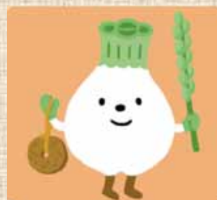
ウポポイPRキャラクター「トウレットポン」