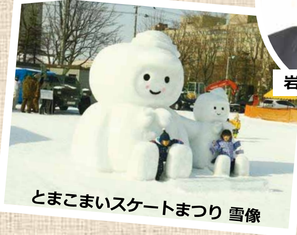
とまこまいスケートまつり 雪像