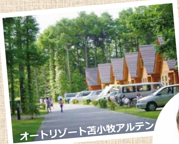
オートリゾート苫小牧アルテン