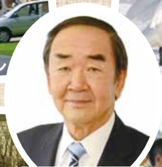
岩倉 博文 市長