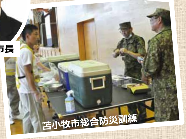
苫小牧市総合防災訓練

苫小牧市の北側に位置する航空自衛隊千歳基地は、北方空域防衛の最大拠点である第2航空団が所属しており、様々な分野でご尽力いただいていることを周辺自治体として深く感謝しております。