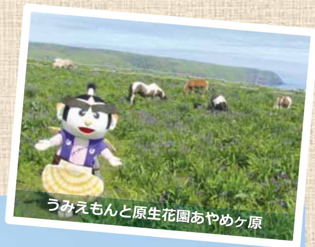
うみえもん和原生花園あやめヶ原