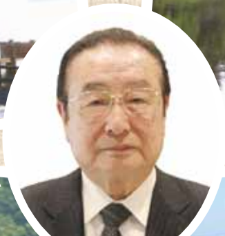
若狭 靖 町長