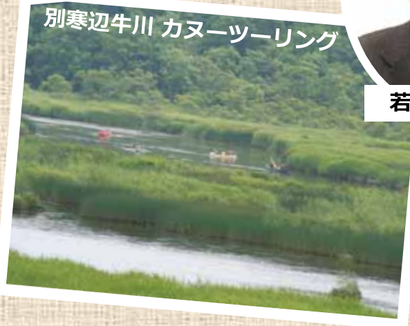
別寒辺牛川 カヌーツーリング