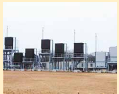
研究試作時の次期警戒管制レーダー装置

より多くの国民の皆様は防衛白書を読んでいただく観点から、これまでの防衛省HPでの無料ダウンロードに加え、民間の電子書籍市場においても無料ダウンロードできるようにしています。