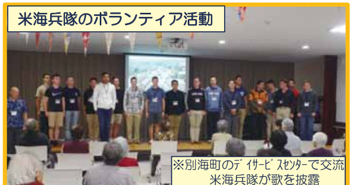
米海兵隊のボランティア活動