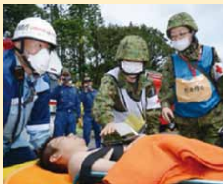
大量傷者受入訓練において現場救護を実施する陸自隊員