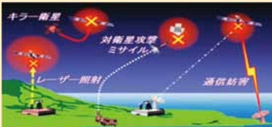
宇宙空間の安定的利用への脅威(イメージ)

3つ目の柱「安全保障協力」については、「自由で開かれたインド太平洋」というビジョンを踏まえた多角的・多層的な安全保障協力として①「二国間・多国間の防衛協力・交流を強化する」、②「グローバルな安全保障上の課題などへの取組を積極的に推進する」といった新防衛大綱の考えを踏まえ、この1年間に実施してきた取組などを記述しています。