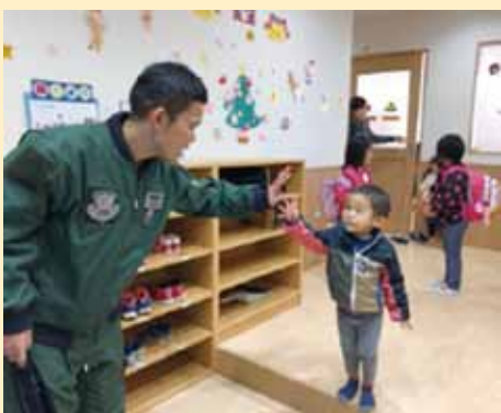
入間基地託児施設を利用する空自隊員

また、①装備体系の見直し、②技術基盤の強化、③装備調達最適化、④産業基盤の強靱化、⑤防衛装備・技術協力の推進といった、防衛装備・技術に関する諸施策について記述しています。