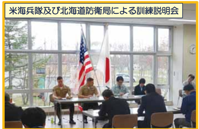
米海兵隊及び北海道防衛局による訓練説明会