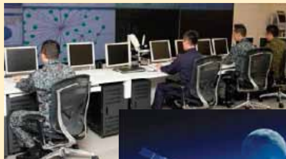
サイバー体制の充実・強化(イメージ)