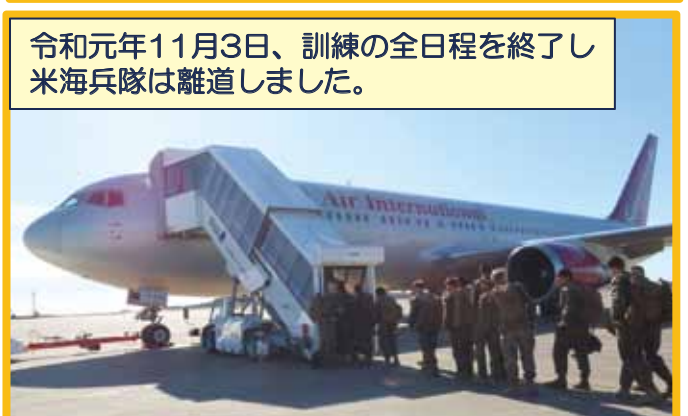
令和元年11月3日、訓練の全日程を終了し 米海兵隊は離道しました。