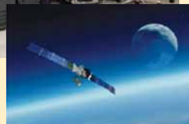
Xバンド防衛通信衛星(イメージ)