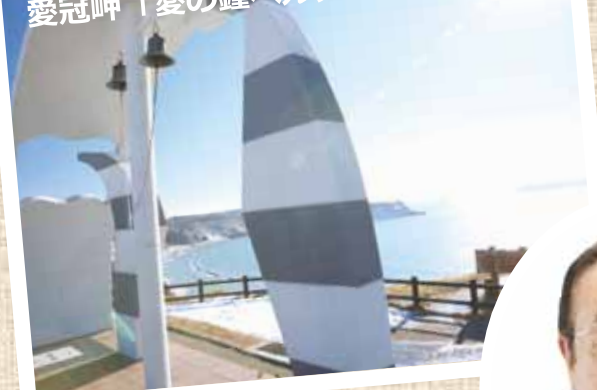
おいかつが 愛冠岬「愛の鐘ベルアーチ」