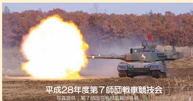
平成28年度第7師団戦車競技会