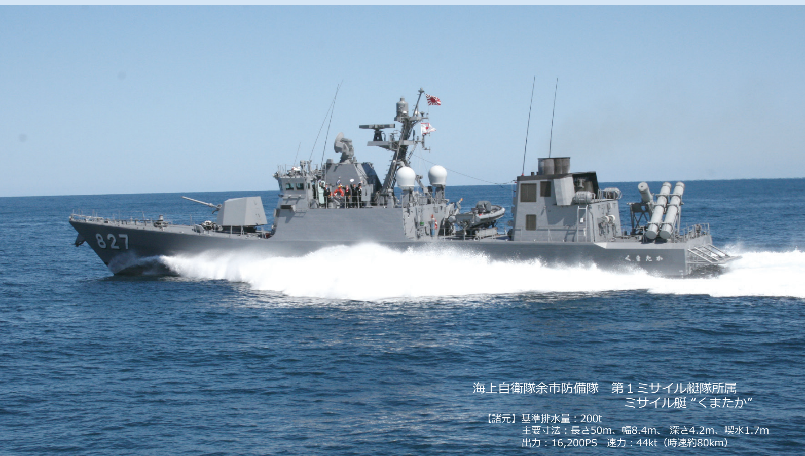
海上自衛隊余市防備隊 第1ミサイル艇隊所属 ミサイル艇“くまたか”

【諸元】基準排水量：200t 主要寸法：長さ50m、幅8.4m、深さ4.2m、喫水1.7m 出力：16,200PS 速力：44kt（時速約80km）