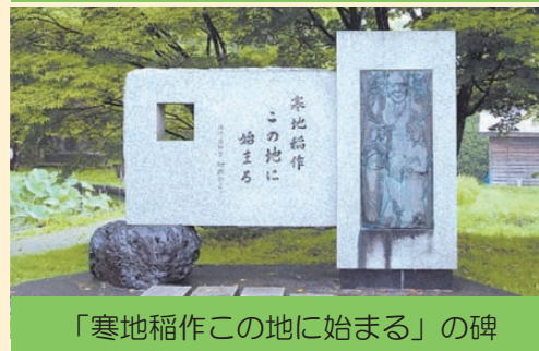
「寒地稲作この地に始まる」の碑