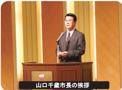
山口千歳市長の挨拶