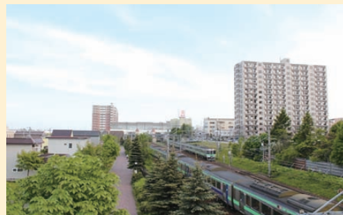
「JR北広島駅」周辺の市街地

北恵庭駐屯地には、当市の防衛・警備と災害派遣等の担当をして頂いており、市主催の各種イベント、防災訓練への参加等様々な場面でのご支援など、安心・安全に尽力を頂いています。