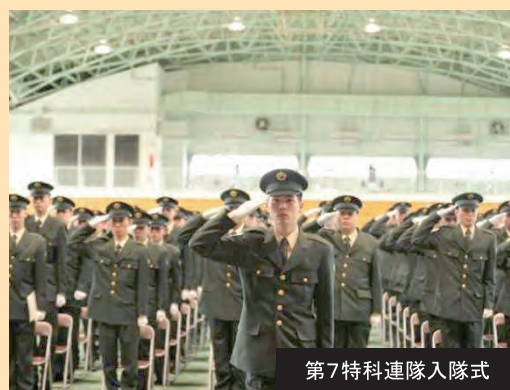
第7特科連隊入隊式

第11普通科連隊中力連隊長より同候補生76名に対し「進んで難局にあたれ」「同期の絆を大切にせよ」の2点を要望。また、「この教育間いかなる状況にあっても、チャレンジ精神を持って何事にも積極的に取り組んでほしい。たとえ困難に当たっても辛抱強く、根気よく、一つずつ乗り越えてもらいたい。」と訓示しました。