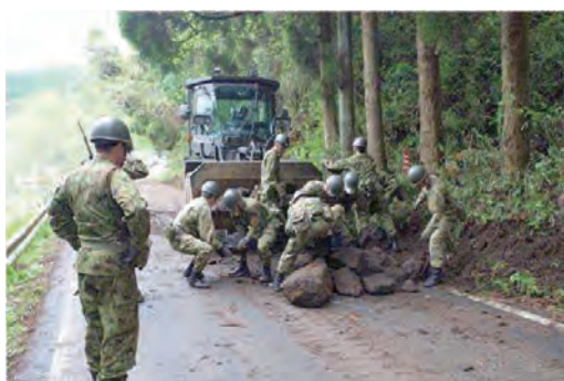
入浴支援 → ← 道路復旧