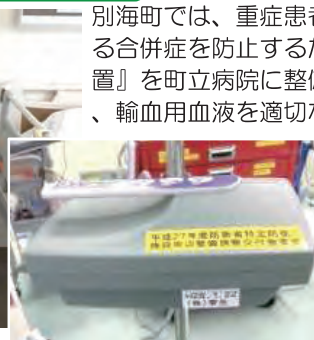
血液・輸血加温装置