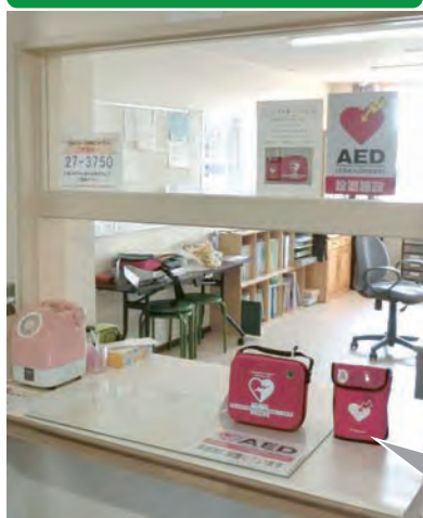
北桜コミュニティセンターに設置されたAED (小児用カートリッジも設置しています)