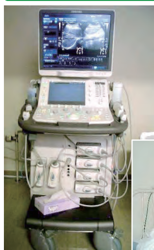
超音波画像診断装置

中富良野町では、超音波を対象物に当ててその反響を映像化する『超音波画像診断装置』やキセノン光線を照射し、関節痛等を軽減させる『キセノン光治療器』等を新たに町立病院に整備しました。