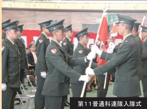
第11普通科連隊入隊式