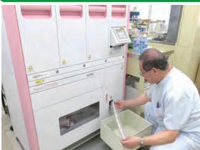
全自動錠剤分包機を使用した錠剤の分包作業