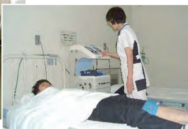
キセノン光治療器による治療模様

中富良野町では、超音波を対象物に当ててその反響を映像化する『超音波画像診断装置』やキセノン光線を照射し、関節痛等を軽減させる『キセノン光治療器』等を新たに町立病院に整備しました。