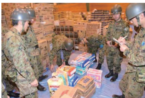
給食支援 → ← 輸送支援