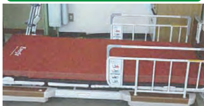
電動式ベッド(13台)を整備