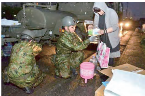
← 給水支援 医療支援 →