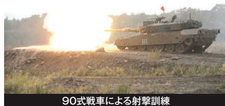
90式戦車による射撃訓練

（民生安定施設整備事業の概要については、特別編集号「防衛北海道（平成26年3月発行）」にも掲載しています。ホームページより是非ご覧下さい。）※ ※北海道防衛局ホームページ： http://www.mod.go.jp/rdb/hokkaido/