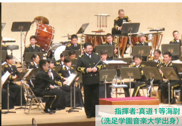
指揮者:真道1等海尉 (洗足学園音楽大学出身)