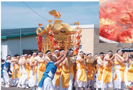
金比羅神社例大祭の神輿運行に参加する隊員