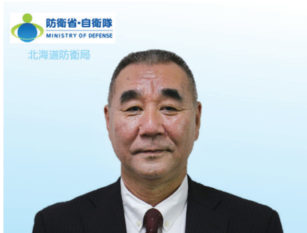
山岡博幸 北海道防衛局長