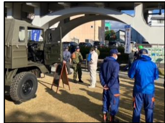
→みんな揃ってロープワーク