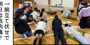
→腕立て伏せで明日は筋肉痛？

12月5日、女性自衛官をゲストとして、岩松小学校での男女共同参画授業に参加させていただきました。女性でも活躍できる自衛隊に興味があれば是非富士地域事務所へ♪