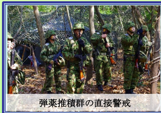
弾薬推積群の直接警戒