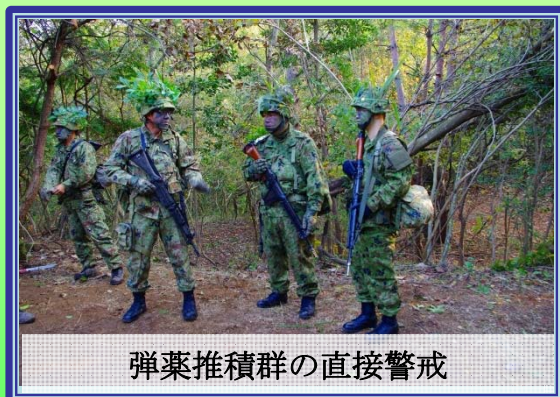
弾薬推積群の直接警戒