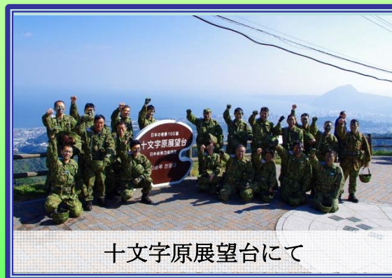
十文字原展望台にて