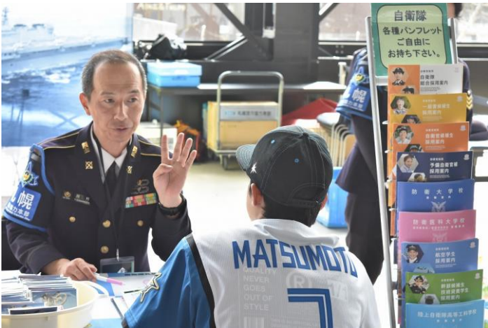
広報官による採用説明