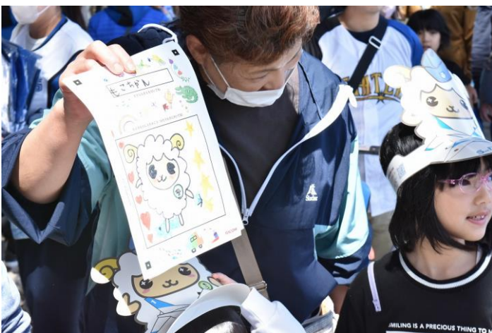
「羊のモコ」の絵を書いてもらう サプライズ