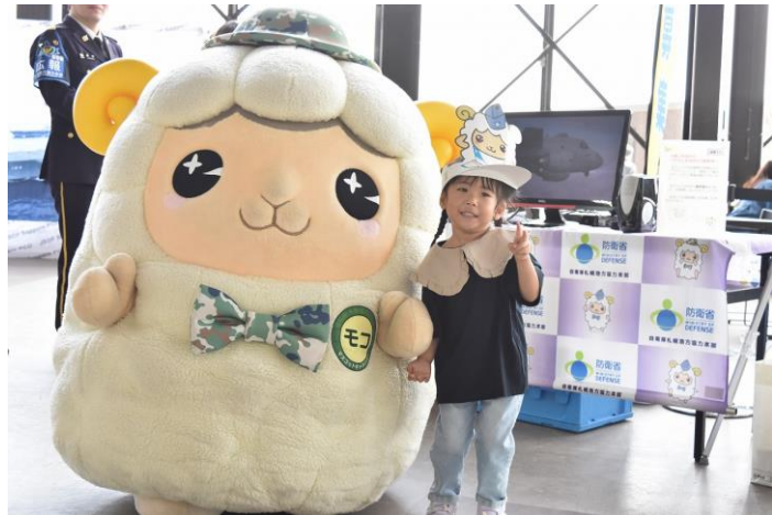
「羊のモコ」と記念撮影