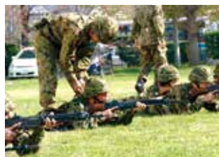
実弾射撃前の訓練