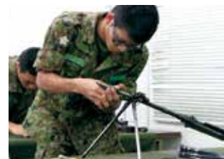
小銃の分解・整備