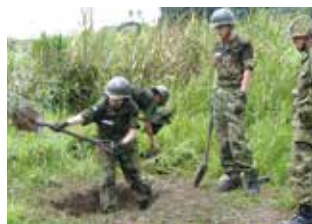
野外での行動(掩体構築)