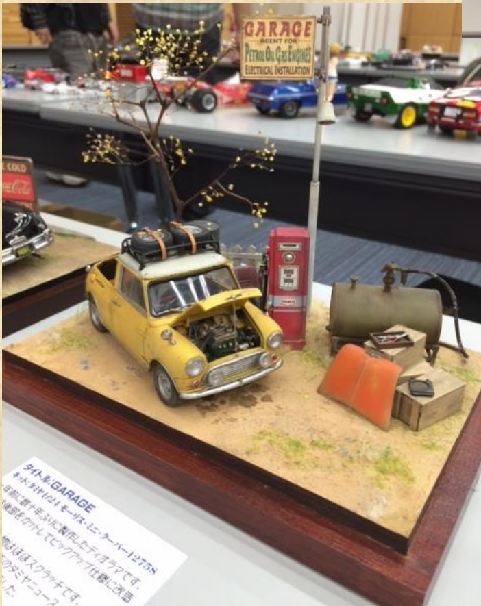
ダイハツ GARAGE キタハチ1/241 モーター・ミニ・クーペ1275S 車体は10年ほど前に購入した中古車です。 塗装を剥がしてデカールが世界に改造 車はほぼ完成です。 完成はまだまだです。