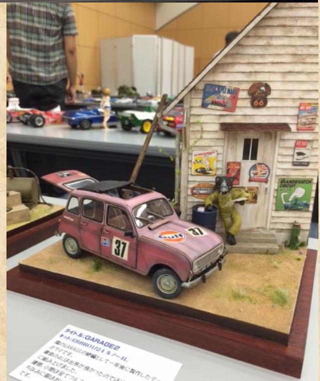
ダイハツ GARAGE2 キタハチ1/241 モーター 車体は10年ほど前に購入した中古車です。 塗装を剥がしてデカールが世界に改造 車はほぼ完成です。 完成はまだまだです。