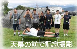
天幕の前で記念撮影