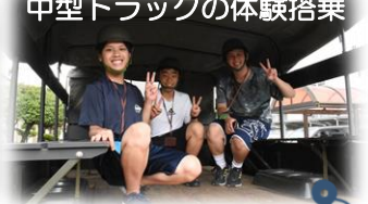
中型トラックの体験搭乗