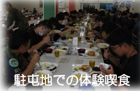
駐屯地での体験喫食