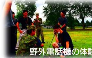
野外電話機の体験