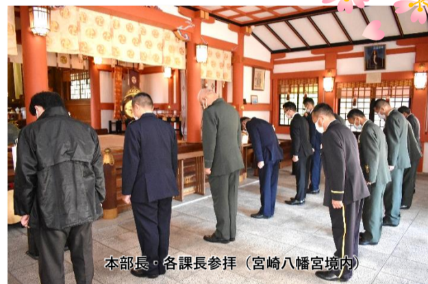
本部長・各課長参拝 (宮崎八幡宮境内)