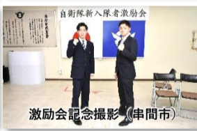
激励会記念撮影 (串間市)