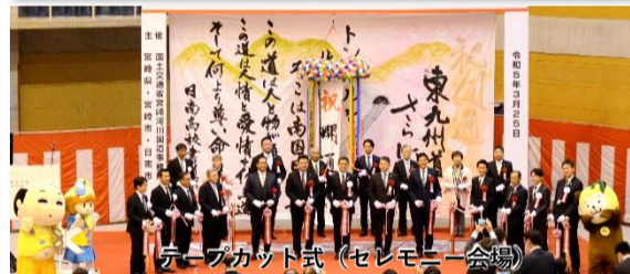
テープカット式 (セレモニー会場)

令和5年3月25日(土)東九州自動車道開通式典に参加しました。陸上自衛隊第43普通科連隊(第3中隊)の偵察オートバイ3両、航空自衛隊高畑山分屯地の軽装甲機動車(LAV)1両の支援を受け開通パレードを行いました。今回開通した東九州自動車道は、日南北郷IC~清武南IC(約18km)の区間であり、南海トラフ大地震の際にR220号線は海に面しており機能しないことが予想されており、自衛隊にとって災害派遣部隊(ファーストフォース)の速やかな派遣に繋がられ、効果的な任務遂行が期待されています。