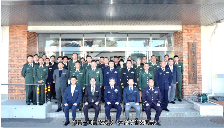
部員一同記念撮影 (本部庁舎玄関前)