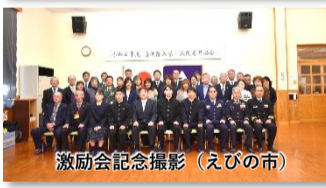
激励会記念撮影 (えびの市)