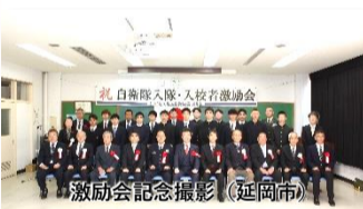
激励会記念撮影 (延岡市)