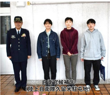
自衛官候補生 (陸上自衛隊久留米駐屯地)