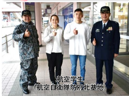
航空学生 (航空自衛隊防府北基地)