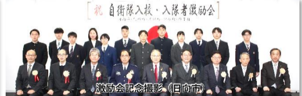
激励会記念撮影 (日向市)

令和4年2月16日(木)~3月20日(月)の間、県内各地において令和4年度入校・入隊激励会が実施されました。新田原基地司令・高畑山分屯地司令・えびの駐屯地司令を始め市町村長、各協力団体の方々からたくさんのお祝いのお言葉を頂きました。