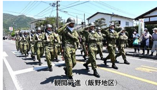
観閲行進 (飯野地区)

令和5年4月20日(木)~4月24日(月)の間、第1次えびの予備自衛官5日間招集訓練が実施されました。本訓練に参加した41名は、えびの駐屯地創立42周年記念行事に参加させていただき、予備自衛官が本行事に令和元年以来4年ぶりの参加であり、大半の方々が初の経験となりました。22日(土)の式典では観閲部隊として、23日(日)には市中パレードに参加し内外に予備自衛官の威容を誇示していました。本訓練は、普段の招集訓練と異なり貴重な経験が出来たとの声が聞かれ有意義な招集訓練になりました。