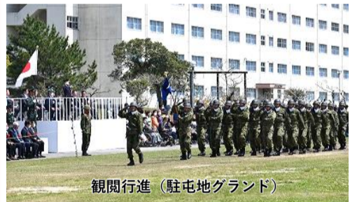
観閲行進 (駐屯地グラウンド)