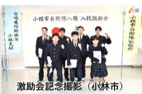
激励会記念撮影 (小林市)