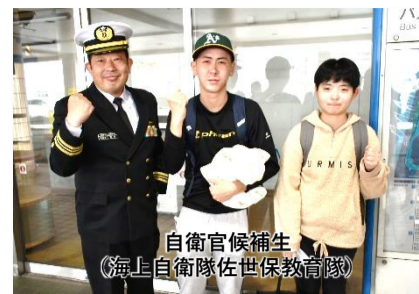
自衛官候補生 (海上自衛隊佐世保教育隊)