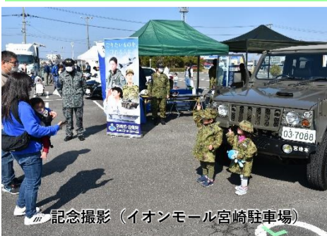
記念撮影 (イオンモール宮崎駐車場)