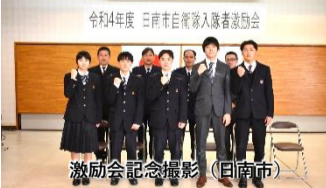
激励会記念撮影 (日向市)