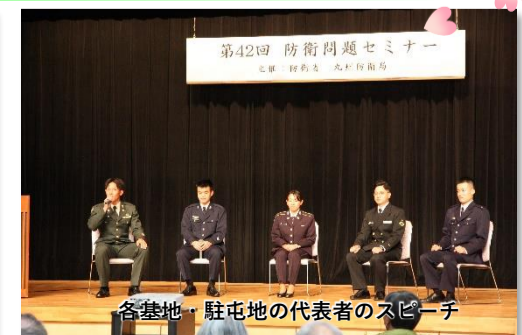
各基地・駐屯地の代表者のスピーチ