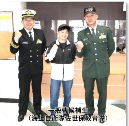
一般曹候補生 (海上自衛隊佐世保教育隊)