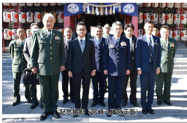
記念撮影 (宮崎八幡宮正面)