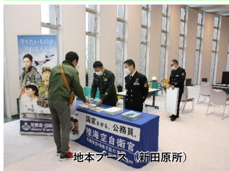
地本ブース (新田原所)