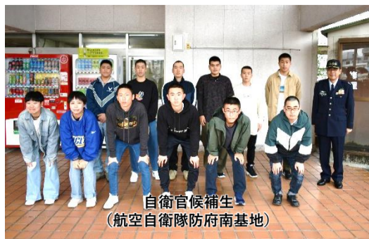
自衛官候補生 (航空自衛隊防府南基地)