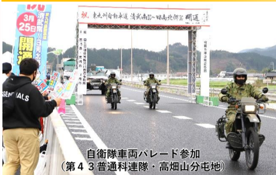
自衛隊車両パレード参加 (第43普通科連隊・高畑山分屯地)