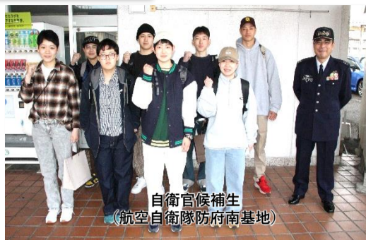
自衛官候補生 (航空自衛隊防府南基地)