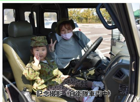
記念撮影 (自衛隊車両中)