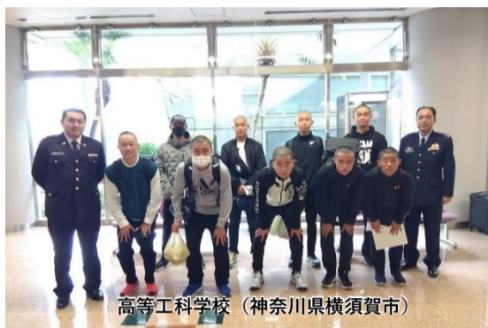
高等工科学校 (神奈川県横須賀市)