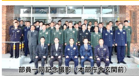
部員一同記念撮影 (本部庁舎玄関前)