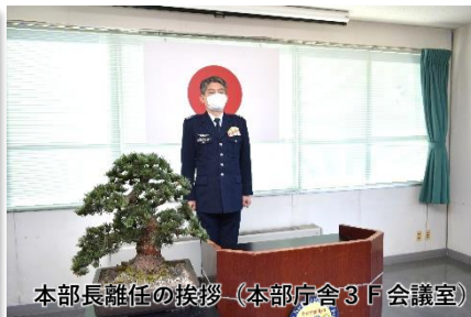
本部長離任の挨拶 (本部庁舎3F会議室)