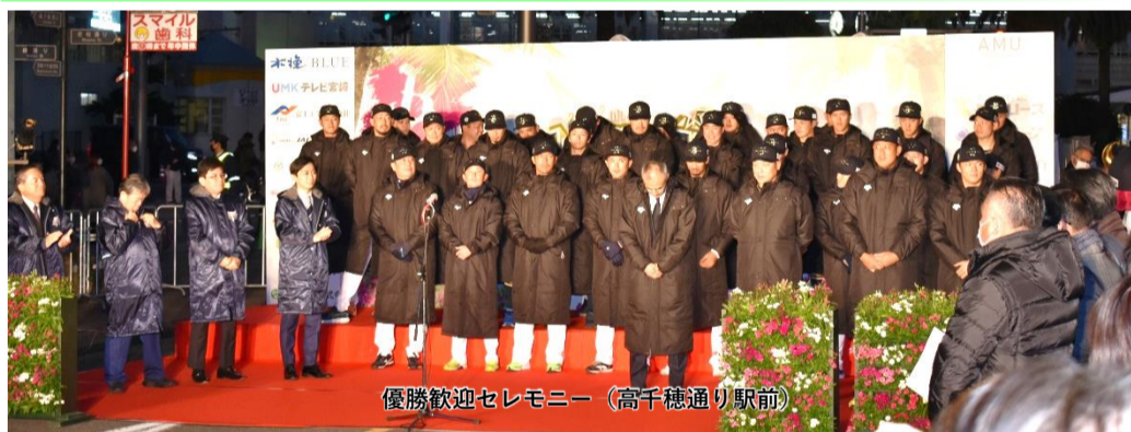
優勝歓迎セレモニー (高千穂通り駅前)