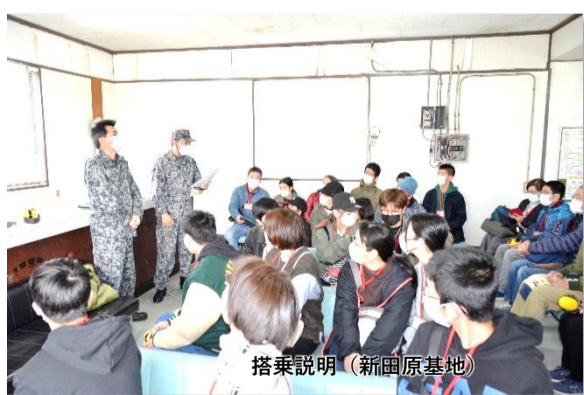
搭乗説明 (新田原基地)