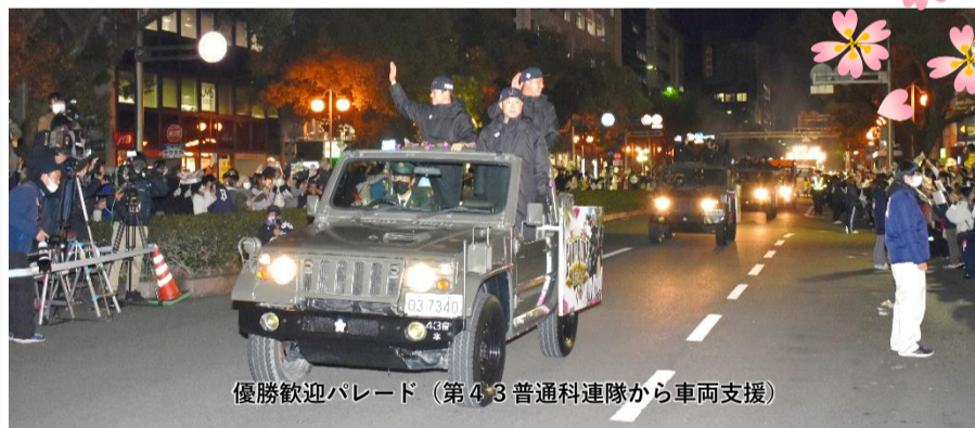
優勝歓迎パレード (第43普通科連隊から車両支援)