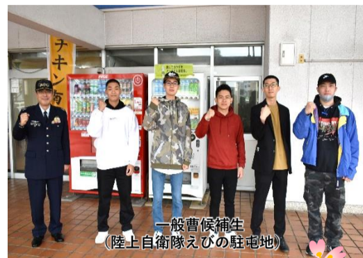
一般曹候補生 (陸上自衛隊えびの駐屯地)