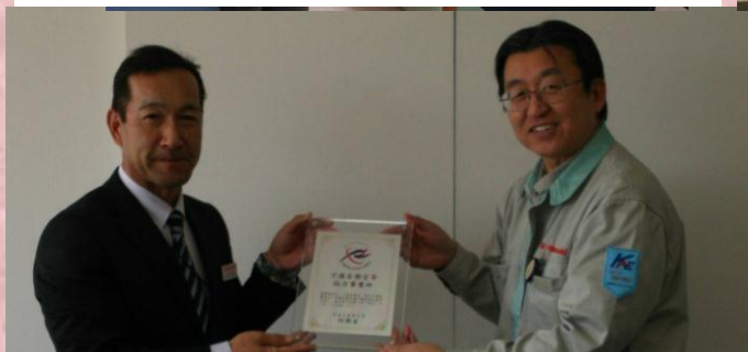
川重明石エンジニアリング株式会社 様