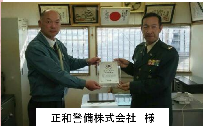
正和警備株式会社 様