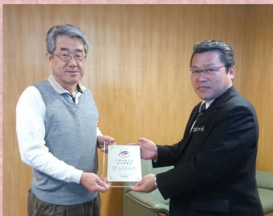
社会福祉法人よ子の広場福祉会 様