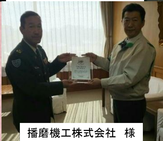
播磨機工株式会社 様