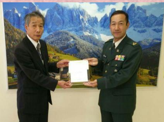
姫信ビジネス株式会社 様