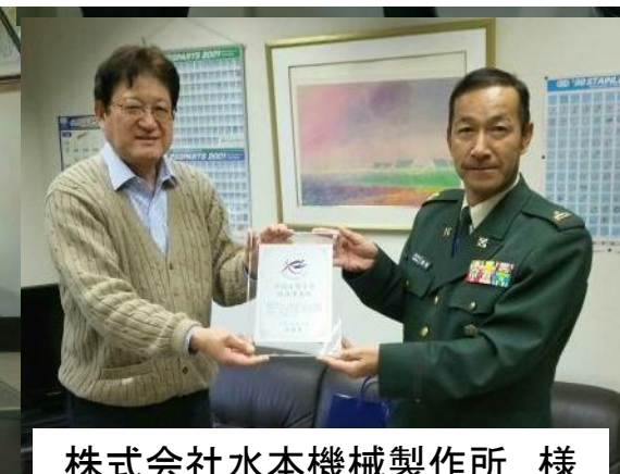
株式会社水本機械製作所 様