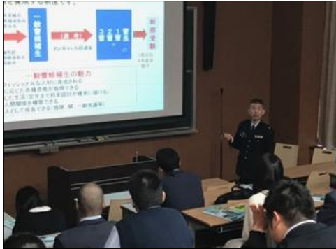
自衛隊の概要の説明