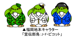
▲福岡地本キャラクター 「宣伝部鳥」J・F・ピコット