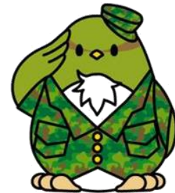
福岡地本キャラクター 「宣伝部鳥J・F・ピコット」