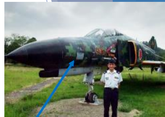
各務原飛行場100周年 記念塗装機「F-4EJ 409号樹」

進路に迷っている方、将来、どのような道に進もうか思案中に方は、自衛隊を選択股の一つとして検討して頂きたいと思います。自衛隊は、様々な職域（仕事）があり、希望や適性によって自分に合った仕事ができる場所です。特に、航空機が好きな方は、それを身近に感じられる飛行場での勤務があります。パイロットを目指すもよし、航空機整備員を目指すもよし、一緒に航空自衛隊で働きましょう！お待ちしております。