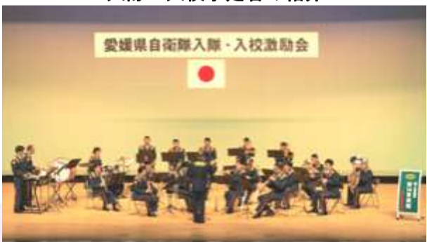
第14音楽隊による激励の音楽演奏