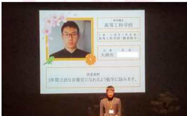
入隊・入校予定者の紹介

入隊・入校予定者の皆さんは、非常に多くの方々から祝意と励ましを受けたことに感激しつつ、入隊・入校への決意を新たにしていまいました。