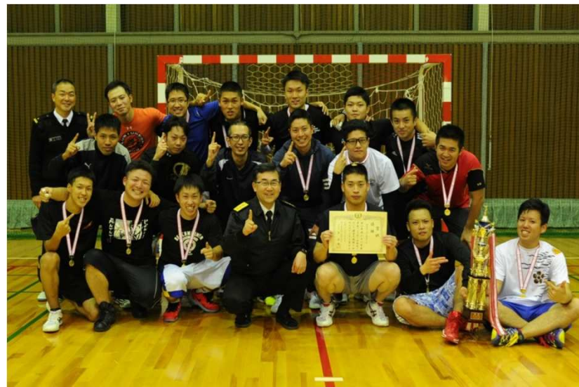
ガスタービン分隊 2連覇達成！！