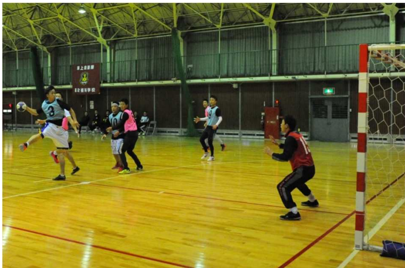
ゴールは俺が守る！！