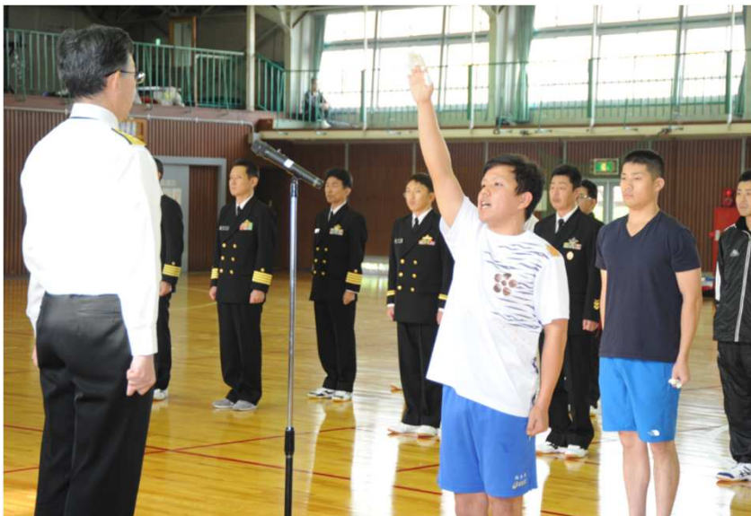
代表選手による選手宣誓