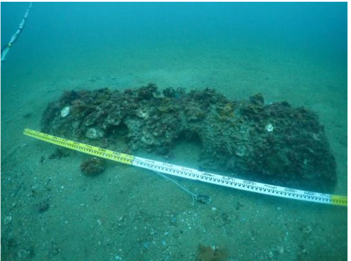
爆発性危険物（太平洋戦争中の米国製機雷）