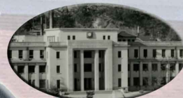
第1術科学校学生館（初代）