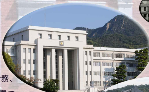
第1術科学校学生館