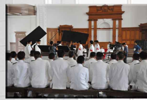
撮影協力(坂の上の雲)

●一口PR：海上自衛隊の学校は、江田島の他、幹部学校（東京都目黒区）、第2術科学校（神奈川県横須賀市）、第3術科学校（千葉県柏市）第4術科学校（京都府舞鶴市）があります。