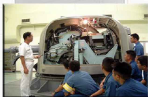
実習(射撃訓練装置)