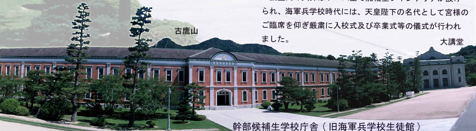
幹部候補生学校庁舎（旧海軍兵学校生徒館）

卒業式等を行う場である大講堂は、大正6(1917)年に瀬戸内海の島々で産出された良質な御影石で造られ、建坪は約500坪、収容人数は約2,000名です。