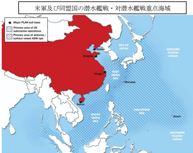
出典：Air-Sea Battle, A Point of Departure, operational concept .p.72.