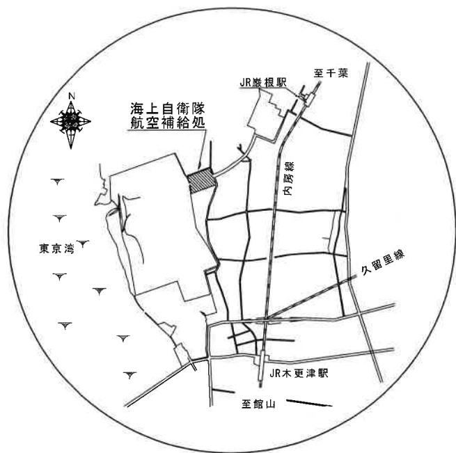
案内図 NO SCALE