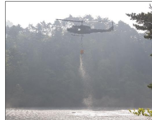
取水をするUH-1の様子