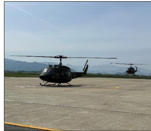
災害現場へ向かうUH-1の様子