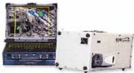
放射線映像表示装置