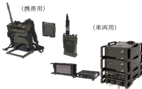
広帯域多目的無線機