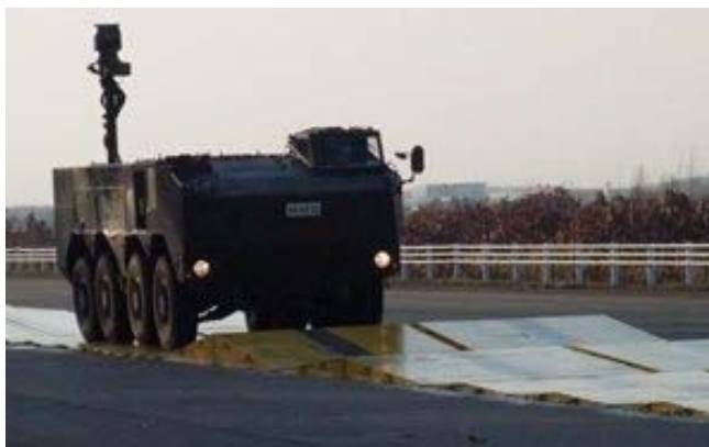
写真：センサ部に対する加振試験