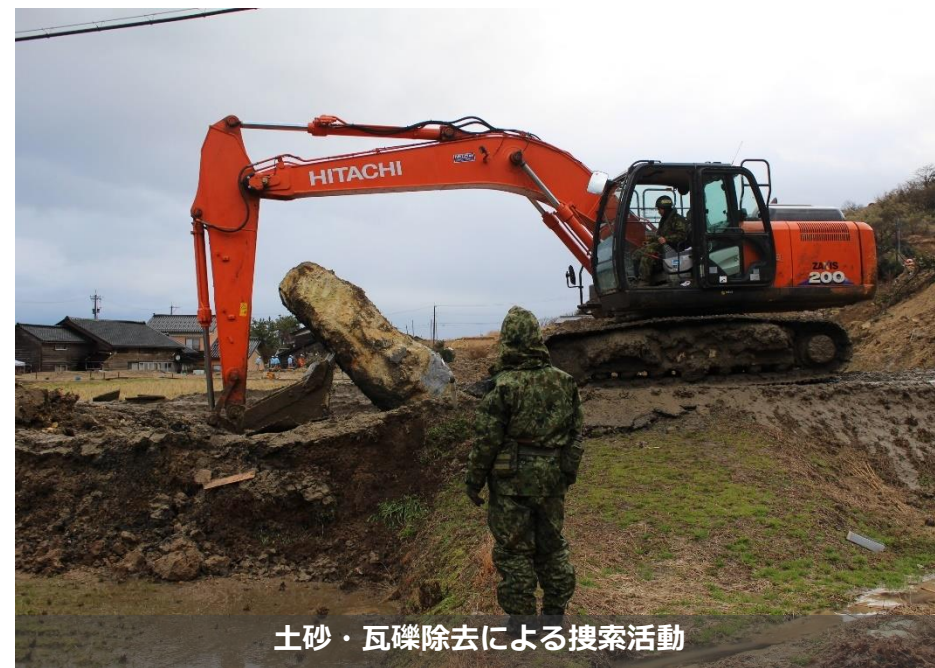
土砂・瓦礫除去による捜索活動