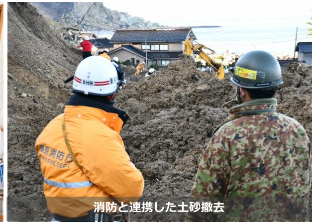
消防と連携した土砂撤去