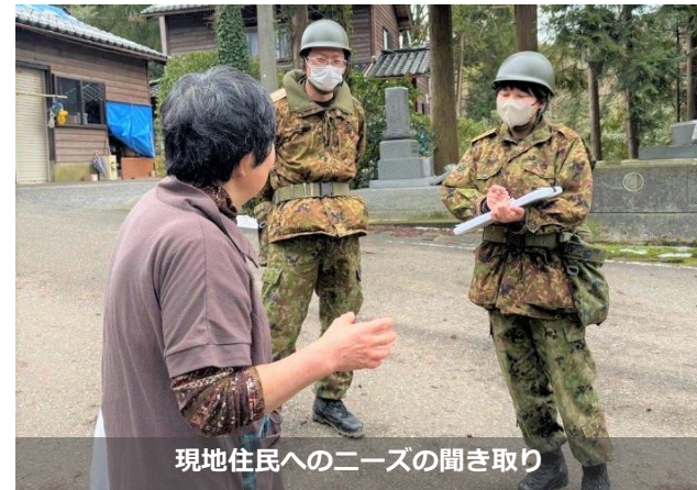
現地住民へのニーズの聞き取り