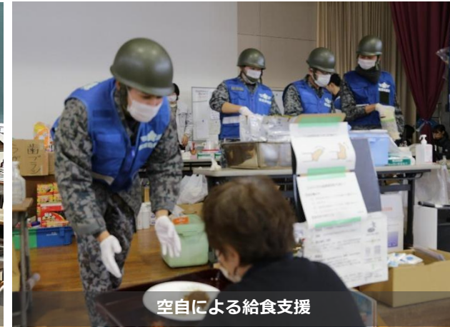
空自による給食支援