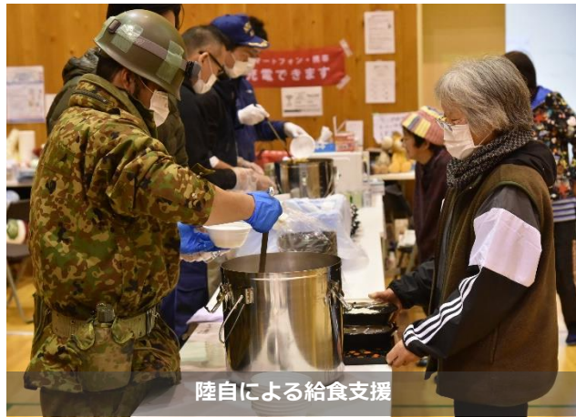
陸自による給食支援