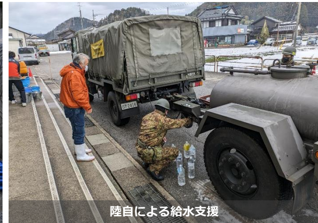
陸自による給水支援