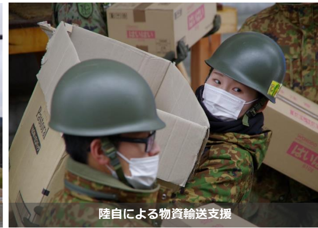
陸自による物資輸送支援