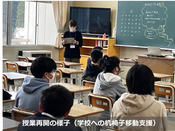
授業再開の様子（学校への机椅子移動支援）