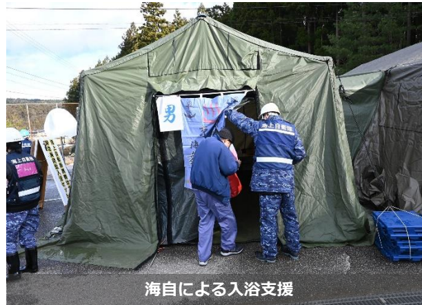
海自による入浴支援