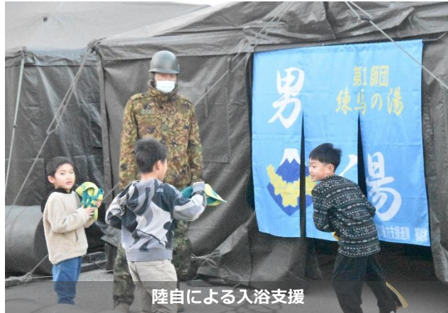
陸自による入浴支援