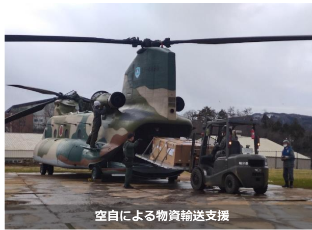
空自による物資輸送支援