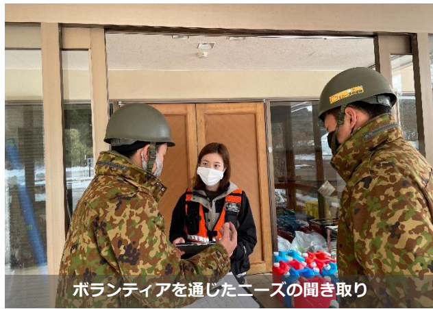
ボランティアを通じたニーズの聞き取り