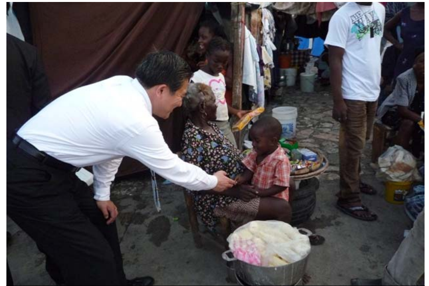
キャンプの子供と