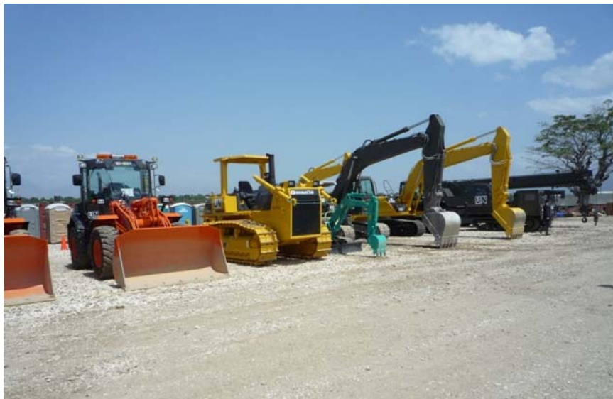
自衛隊の使用する重機類。地面は砂利