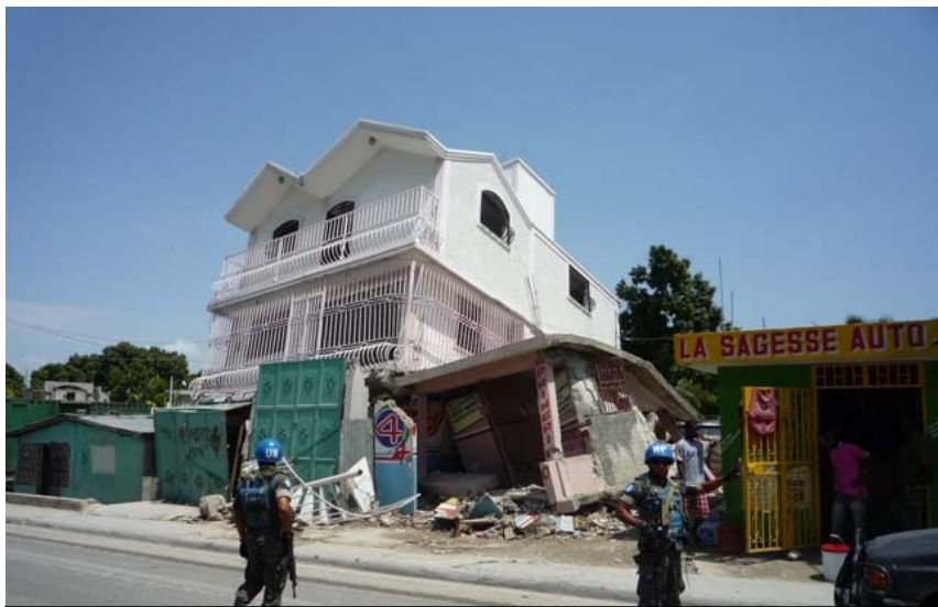
1階部分が倒壊した家屋と警戒するグアテマラ兵