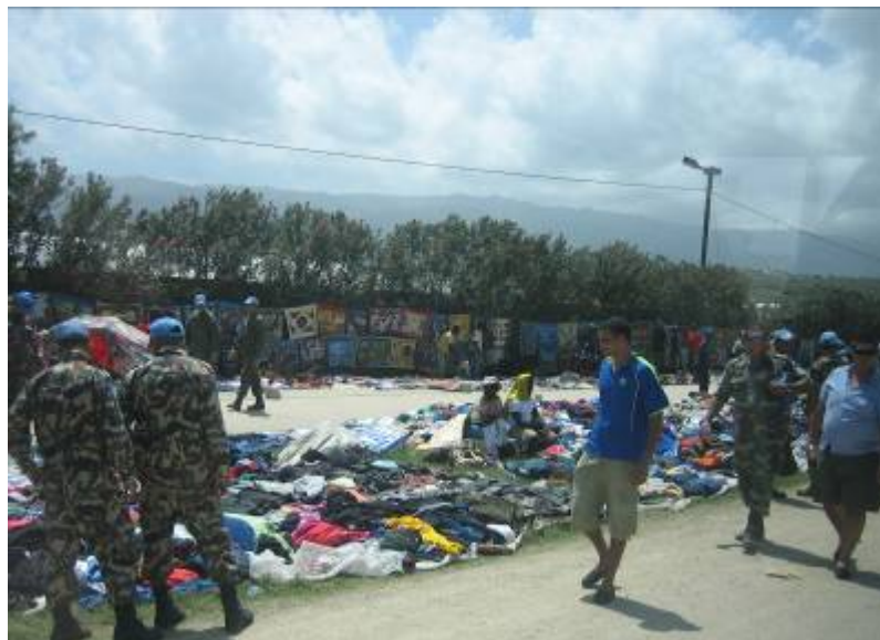
キャンプチャリー付近の賑わい。