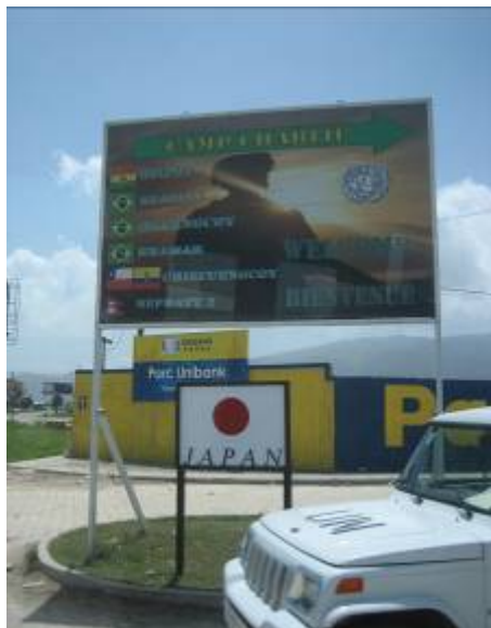
自衛隊宿営地(キャンプチャリー)入口