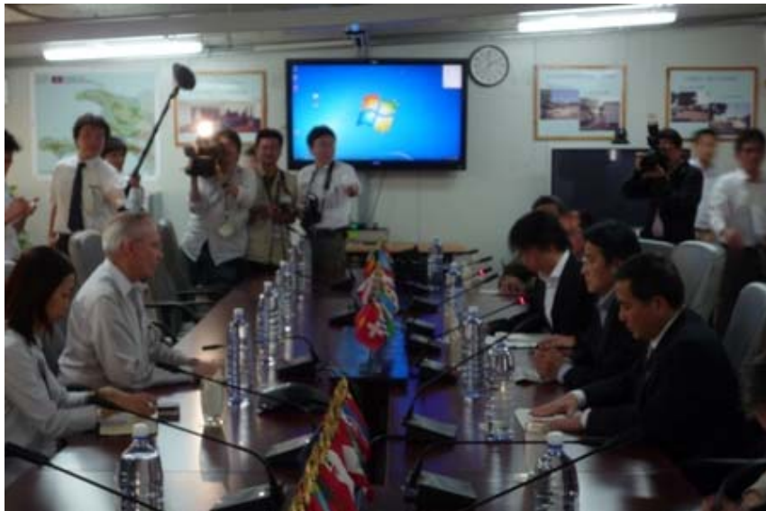
ミュレ事務総長特別代表代行への表敬