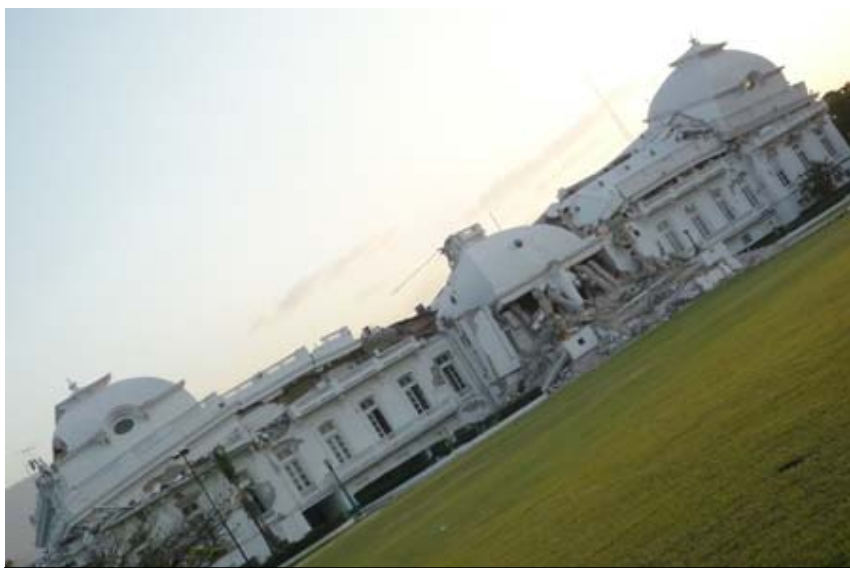
倒壊した大統領府(正面から)