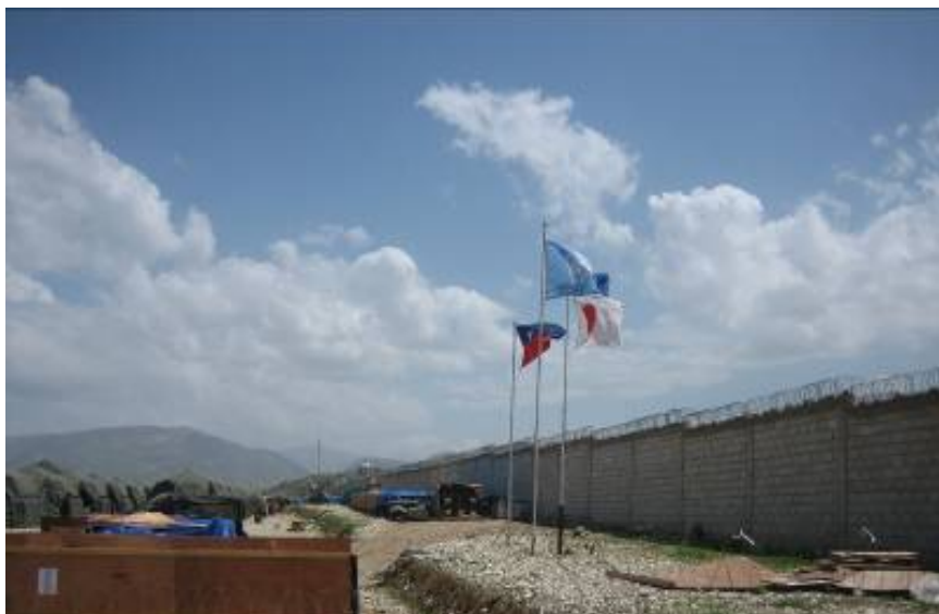
国連旗、日の丸、ハイチ国旗