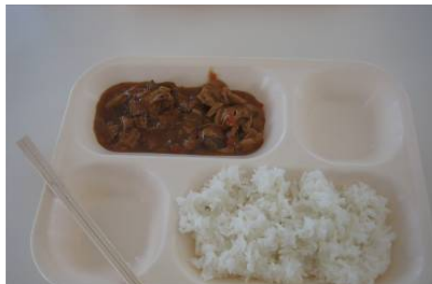
この日のメニューはさばの味噌煮風。戦闘糧食は約21種類