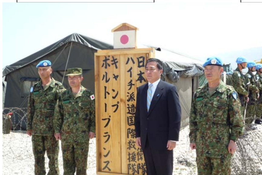
中央即応集団司令官・第1次及び第2次隊長と