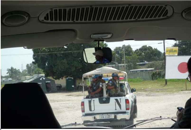
先導する国連軍警備兵(グアテマラ軍)