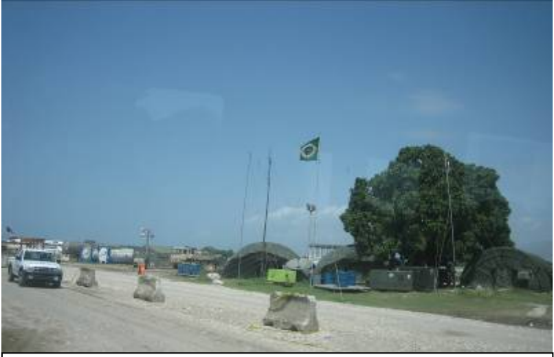
空港敷地内のブラジル軍