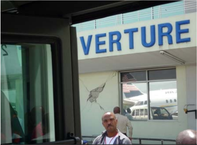
損壊した空港の建物。この部分は中が使えない。