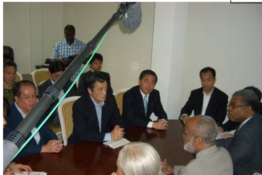
プレヴァル大統領への表敬(手前真中、髭の人物)