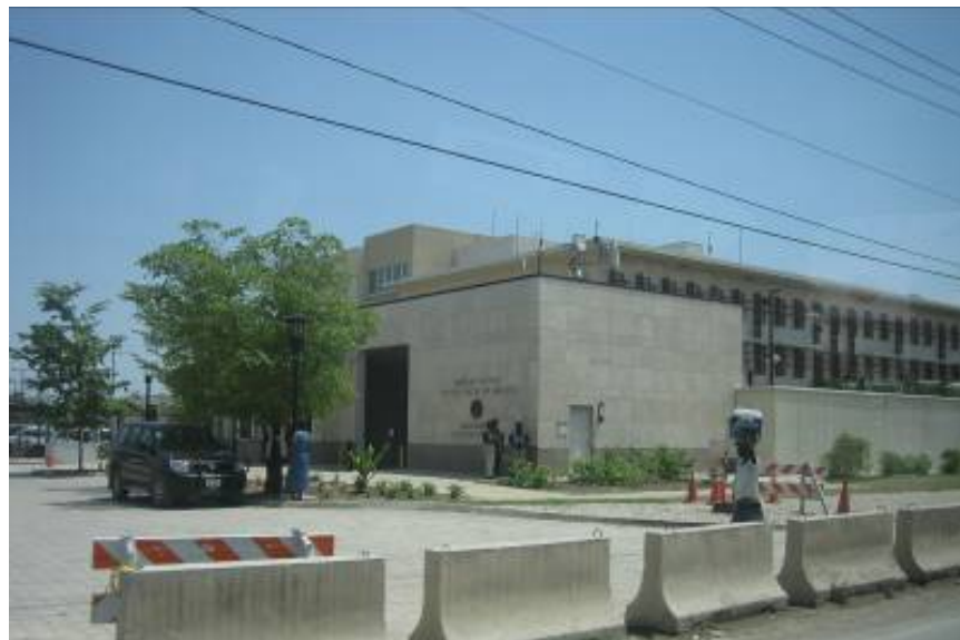
在ハイチ米国大使館