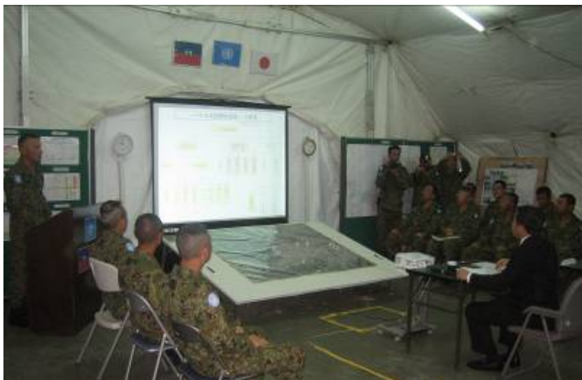
テント内でのブリーフィング。冷房はついているが、ピーク時はやはり暑い。