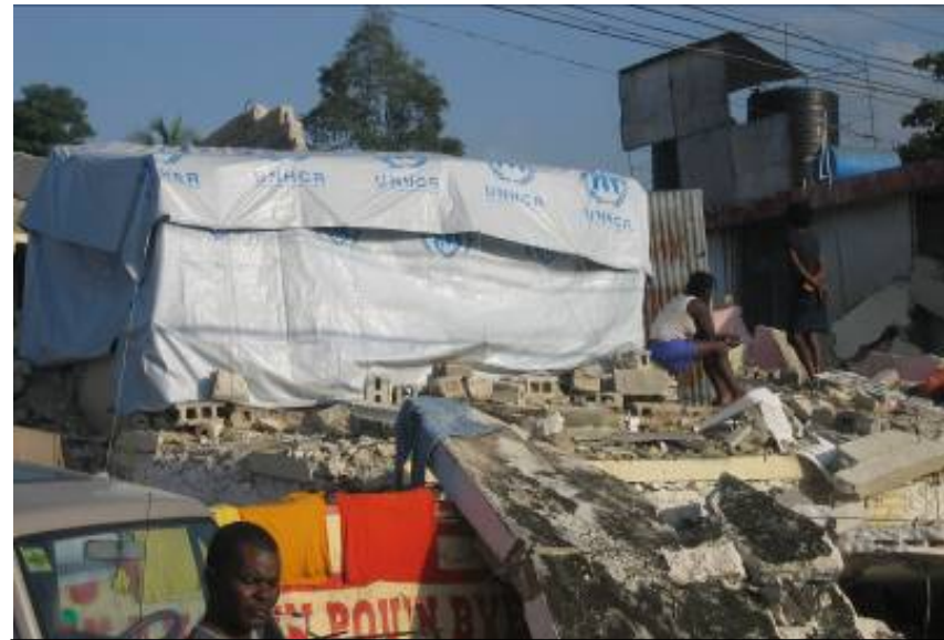
倒壊した自宅の上に張ったテント脇で座り込む住民 (中流階級が居住する地区)