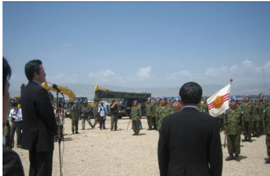
岡田外務大臣の激励挨拶