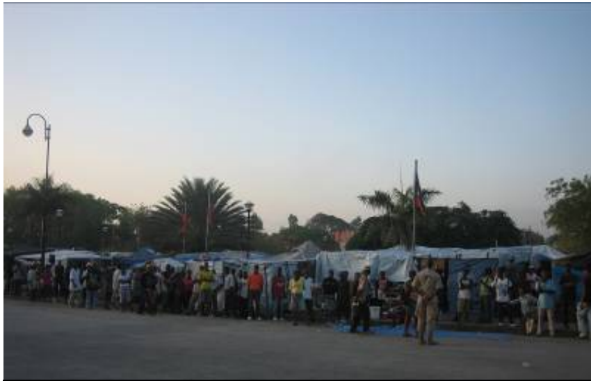
避難民キャンプ化した大統領府前広場