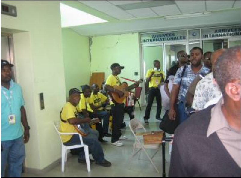
空港での歓迎(?)の演奏