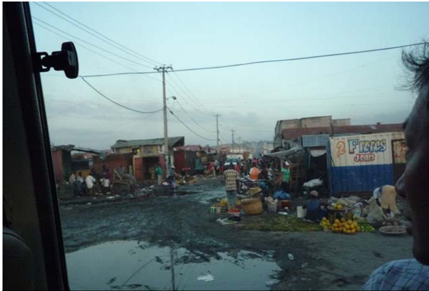
スラム街。建物が粗末なため、却って地震の被害は少ない。