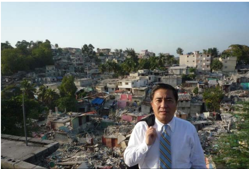
丘の上から見たハイチ市内