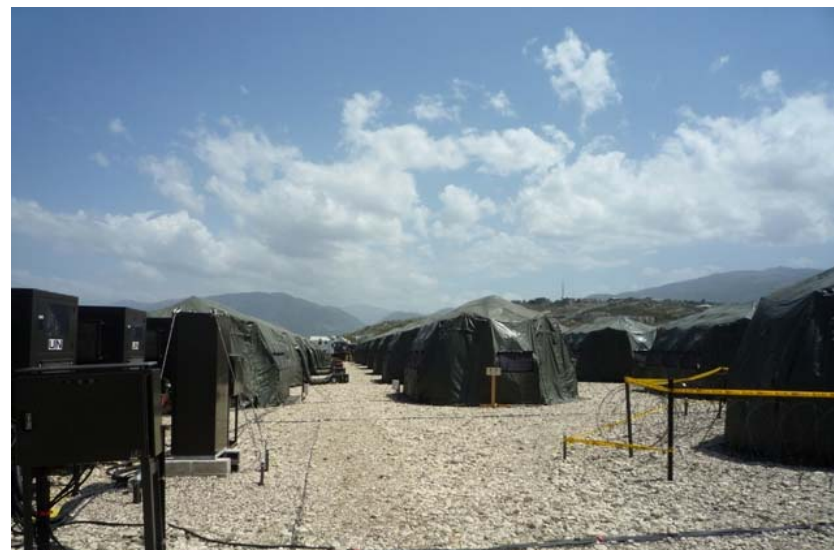
整然と並ぶテント