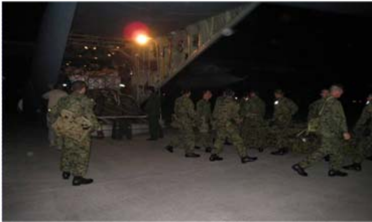
医療援助隊 ポルトープランス到着時の様子