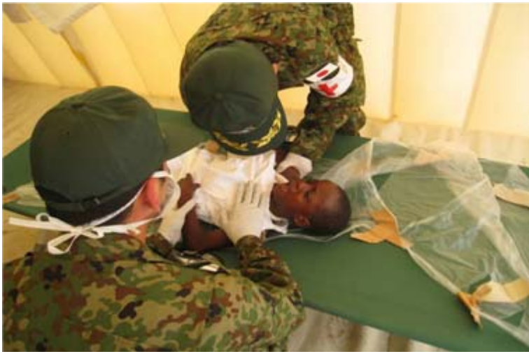
レオガンでの子供の診察の様子