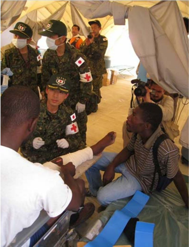
レオガンでの自衛隊による診察第1号男性 （左膝靭帯損傷）