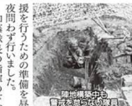
陣地構築中も奮闘する隊員たち

検閲は、六月十八日早朝の非常呼集から始まり、応急出動訓練として中隊事務所、各倉庫、営内居室などのあらゆる物を返納品・追送品・私物・破棄品に分け各項目ごとに表記し箱詰め(段ボール三〇〇個以上)しました。また、中隊本部は二十日から日出生台演習場にて指揮所及び炊事所の開設・運営を行い、交通小隊は油圧ショベルなどの施設機械を駆使して、日向山周回道の維持補修と〇三式中距離地对空誘導弾発射装置の露天掩体構築、渡河器材小隊は大矢野原演習場にて自走架柱