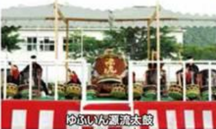
ゆふいん源流太鼓