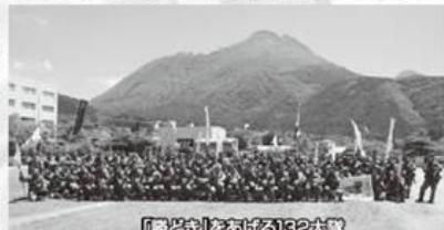
「勝どき」における132大隊

平成三十年六月三日(日)から六月七日(木)までの間、平成三十年大隊訓練検閲を日出生台演習場にて受閲しました。 今回の訓練検閲課題は「陣地防御における師団特科隊に配属されたMLRS部隊としての行動」でした。その中で、平成三十年大度大隊訓練検閲を日出生台演習場にて受閲しました。