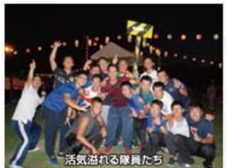
活気溢れる隊員たち