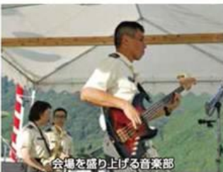
会場を盛り上げる音楽部