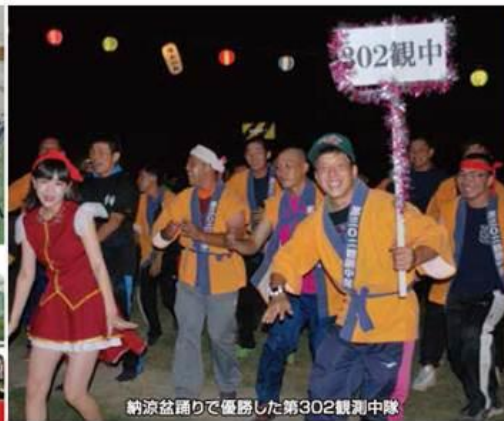
納涼盆踊りで優勝した第302観測中隊

平成三十年八月八日(水)、湯布院駐屯地グラウンドにおいて、満天の星空のもと納涼大会を行いました。今年には「ゆふいん源流太鼓」の皆様や大分県ご当地アイドル「Chinoi」の歌とダンスで会場を盛り上げていただきました。納涼盆踊りでは、隊員と会場が一体となり、とても良い納涼大会となりました。今後も地域の方々と連携し、絆をより深めて親しみやすい駐屯地を目指していきます。