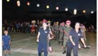
流行曲「そだねー」盆踊り隊