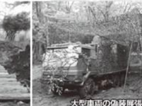
大型車両の偽装展張