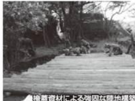
掩蓋資材による強固な陣地構築

平成三十年五月十二日(土)から五月十五日(火)までの間、日出生台演習場において、中隊訓練検閲を受閲しました。中隊は、この訓練を今年度前半の最も重要な目標として、訓練を積み重ねてきました。行動開始後、まずは与えられた作戦地域に防御のための陣地を占領し、昼夜を問わず警戒を行い敵の襲撃から安全を確保しました。それと同時に、施設部隊と連携して工事を行い砲撃などからの被害を極限するための強固な防衛陣地を構築しました。また、敵部隊の砲迫射撃を標定して火力戦闘に寄与し、「生き残って任務を完遂せよ」の中隊長要望事項のもと全隊員が一致団結して与えられた任務を遂行しました。 昨年度配属された隊員にとっては初めての訓練検閲でしたが、先輩隊員から指導をもらいながら多くの困難を乗り越えて、自衛官としての自信をつけることができました。 今回の訓練検閲で得た教訓事項を今後の訓練に活かし、より精進な中隊を目指していきます。