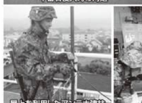
屋上を利用したアンテナ建柱