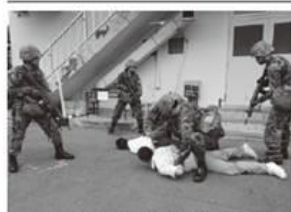
不審者侵入時の対処

なりました。派遣隊員全員が確実に訓練検閲状況下に入り、あらゆる通信ニーズ及び通信所防護に熱心に取り組み、「任務を完遂する!」という強い信念を貫き、無事に訓練検閲を終了することができました。