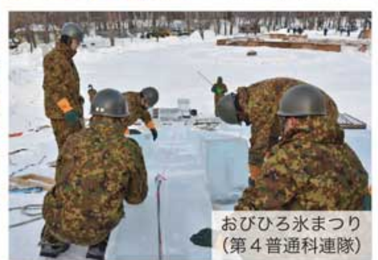
北部方面隊の活動はホームページ及び各種 SNS をご覧ください。チャンネル登録及びグッドボタンをよろしくお願いします。