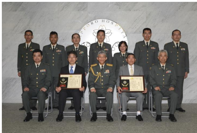
感謝状贈呈後の記念撮影